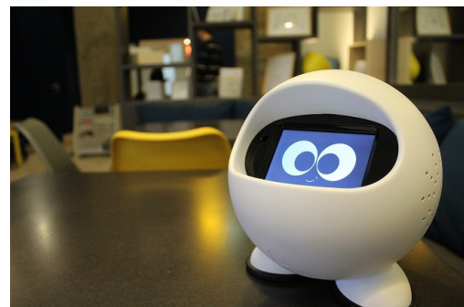
FIGURE 1 – JOE, le robot-compagnon

pas bonne. Des études [2] [3] ont montré qu'en moyenne 60% des asthmatiques ne prennent pas régulièrement, ou prennent mal, voire pas du tout leur traitement de fond. En effet, nombreux sont les malades qui omettent volontairement ou involontairement leur prise de traitement sous prétexte que leur état actuel n'en montre pas le besoin. Or le traitement de fond doit justement être pris régulièrement et sans interruption pour être efficace. C'est de ce constat qu'est né JOE, un robot-compagnon qui vise à aider des enfants asthmatiques dès 3 ans à prendre rigoureusement leur traitement, de manière autonome. L'enjeu est double : améliorer l'observance des traitements de fond des enfants et rendre l'enfant plus autonome car les parents confient à JOE une partie de la gestion quotidienne de la maladie de leur(s) enfant(s). Dans cette démonstration, nous allons présenter JOE, en particulier le déroulement d'une prise de traitement, tout en expliquant son fonctionnement.