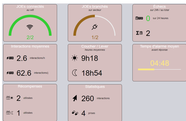
FIGURE 3 – Indicateurs du tableau de bord LUDOCARE

L'un des objectifs de cette analyse est d'avoir un suivi global des JOEs. Par le biais d'indicateurs qui alimentent un tableau de bord (consultable localement et uniquement par LUDOCARE), il est ainsi possible de connaître le nombre d'échecs lors des prises, le nombre total de prises, le nombre total et moyen d'interactions, le temps moyen d'alarme, ... (cf. figure 3). Il s'agit d'une analyse plutôt statistique qui vise à fournir aux dirigeants de LUDOCARE des données directement exploitables concernant l'utilisation des JOEs, mais pas seulement, vu qu'elle permettrait également de détecter les mésusages des médicaments.