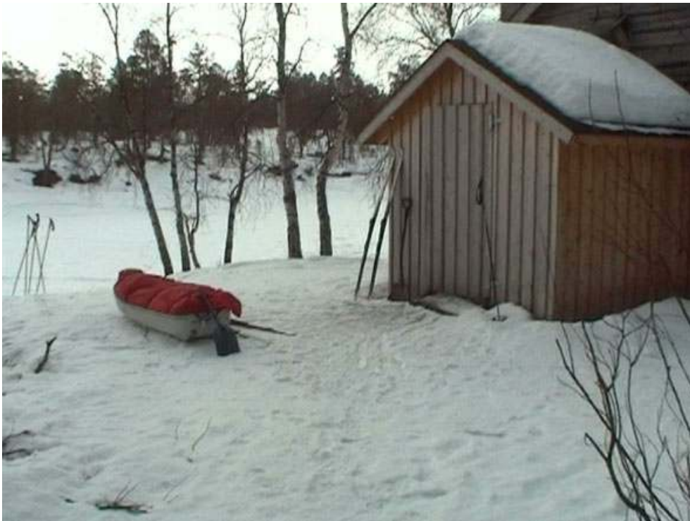
Arrivée dans un refuge – Expédition Finlande 2004