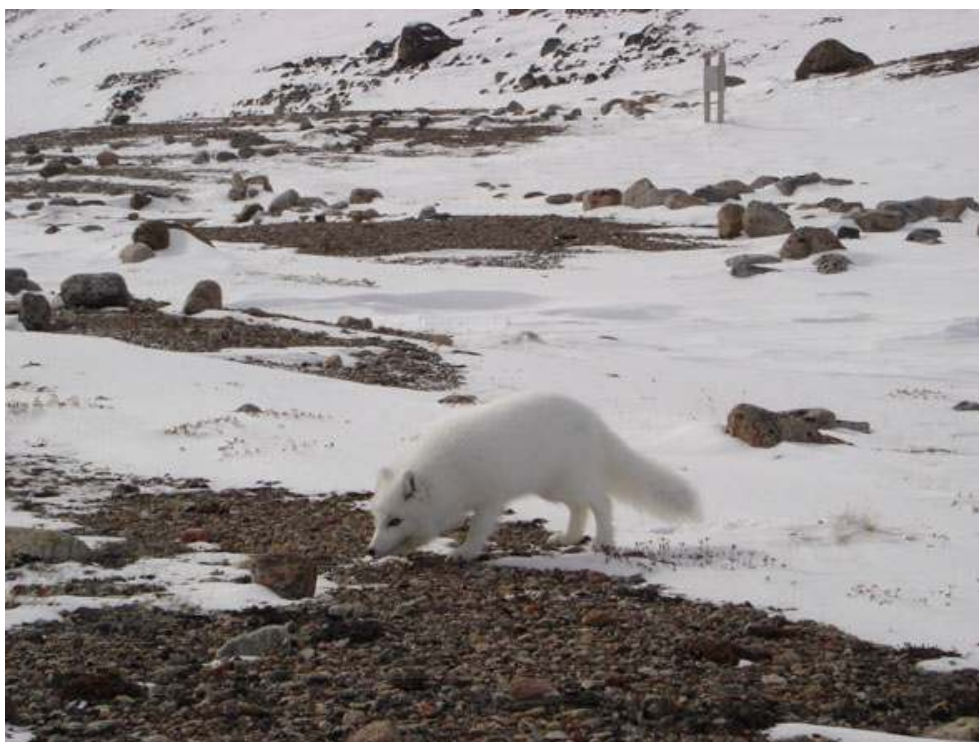
Un renard rôdant autour du camp – Expédition Baffin 2005