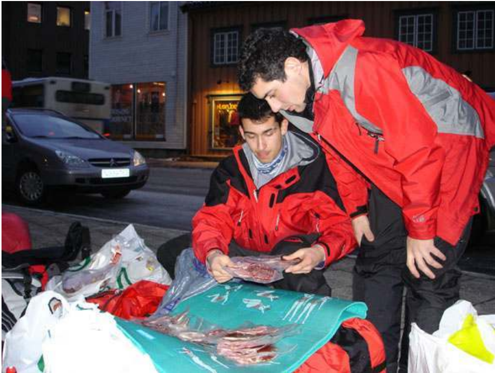
Préparation de la pulka avant le départ en bateau – Expédition Norvège 2005