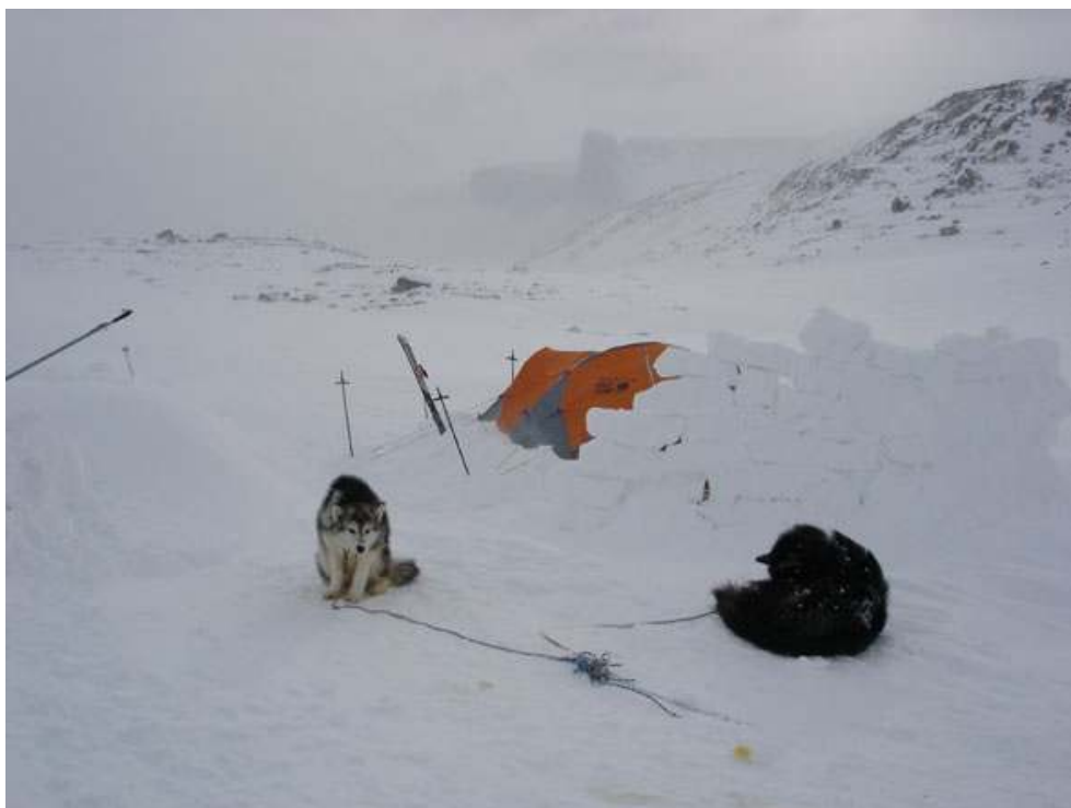
Camp sur la banquise – Expédition Baffin 2005