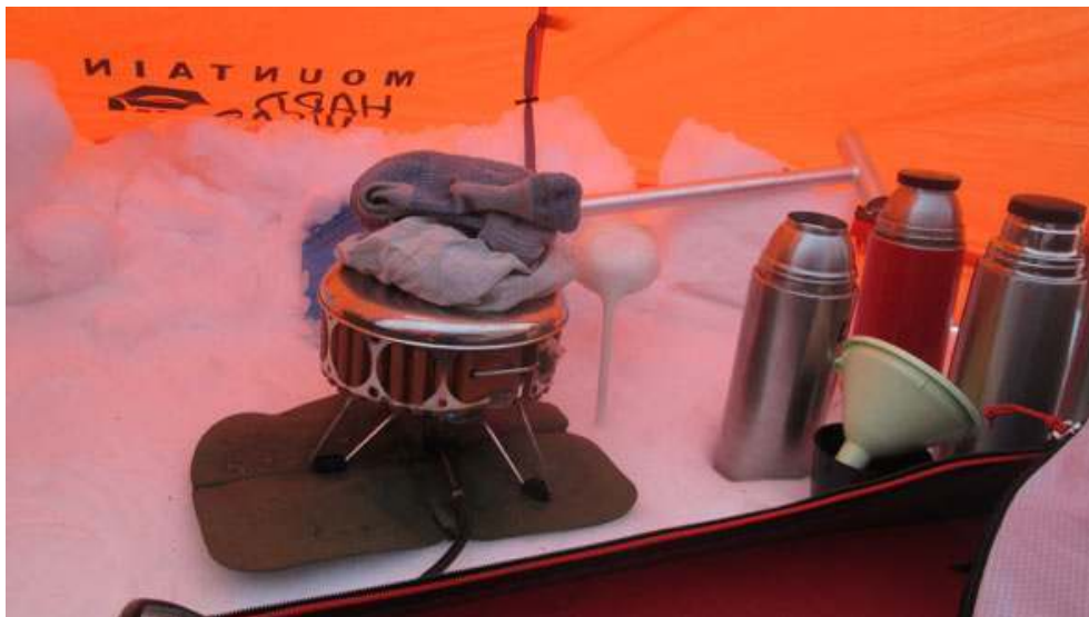
Installation du réchaud dans une abside dédiée – Expédition Finlande 2015