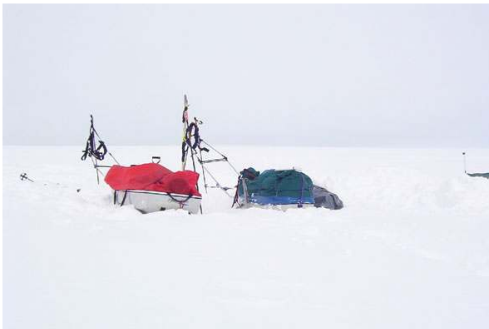
Pulkas de différentes dimensions – Expédition Groenland 2003