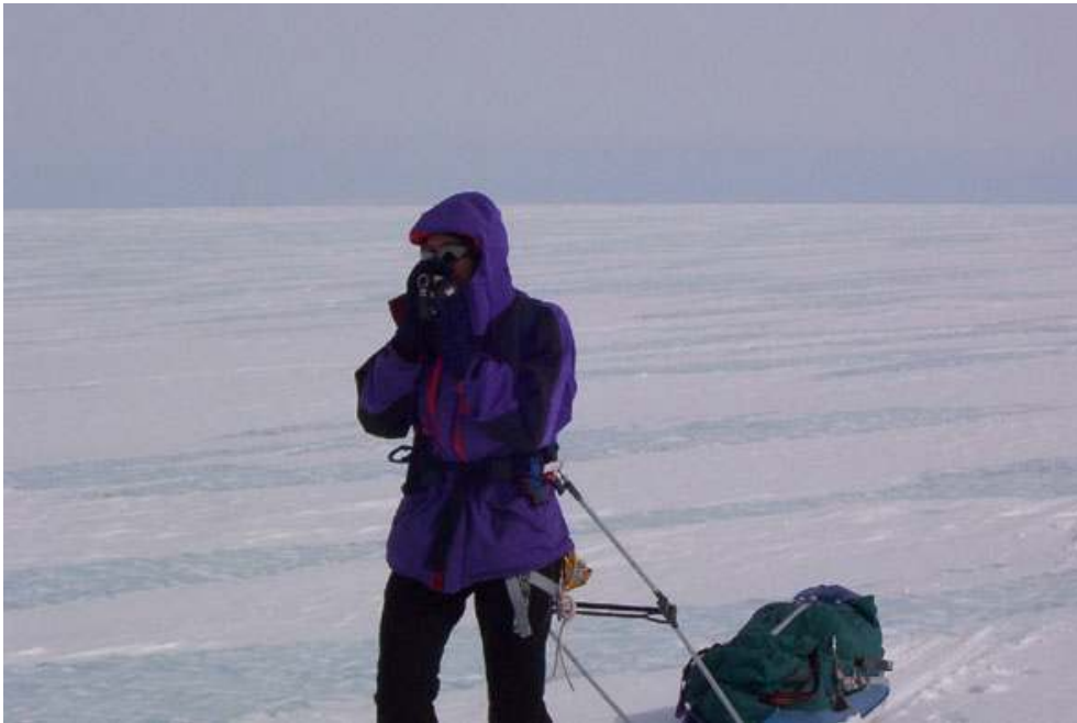
Construction de quelques traces vidéos – Expédition Groenland 2003