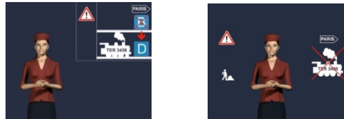
Figure 2 : Format juxtaposé (à gauche) et intégré (à droite) du message couplé « changement de voie »

présentés en alternance totale / messages présentés avec un démarrage synchronisé / synchronisation de sous-parties (blocs) du message ayant la même signification (synchronisation « sémantique ») / synchronisation par bloc sémantique. Parmi les huit formats de couplage correspondant à toutes les combinaisons obtenues, six ont été testés.