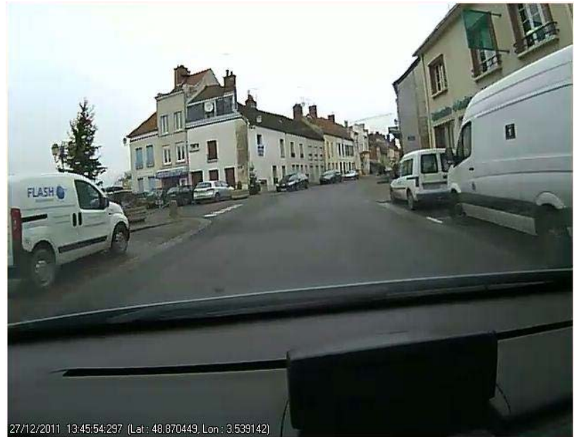
Vue scène avant