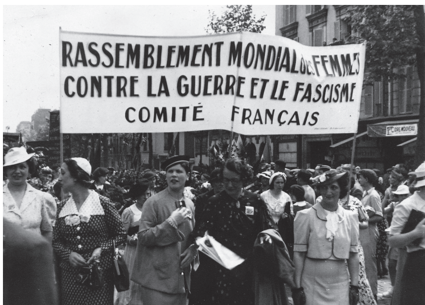
▲ Fig. 10 – Rassemblement mondial des femmes contre la guerre et le fascisme, s.d.

Bernadette Cattaneo concourt également aux directions nationale et internationale du Rassemblement universel pour la paix, à travers l'organisation de sa commission féminine. Portée par ses qualités personnelles et les procédures communistes de promotion de cadres venus des classes populaires, la jeune militante affiche fièrement ses origines modestes et en souligne la forte signification symbolique quand elle est reçue à la SDN, à Genève, aux côtés de Clara Malraux et de Gabrielle Duchêne (► fig. 11):