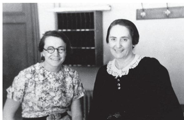
▲ Fig. 3 – Militant-e-s de la CGTU devant le siège de la rue de la Grange aux Belles, Paris, s.d.