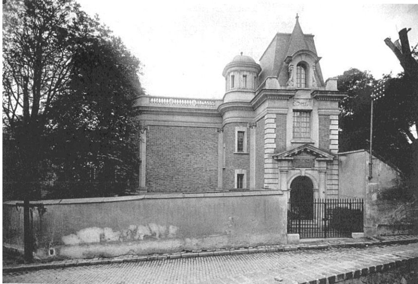
III. 03 : Vue depuis la rue de la bibliothèque Smith-Lesouëf, peu après son achèvement.