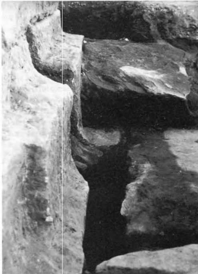
2. Détail de la jonction des deux murs. Assises inférieures juxtaposées, assises supérieures encastrées, vue prise vers le sud. (Cl. Th. Zimmer).