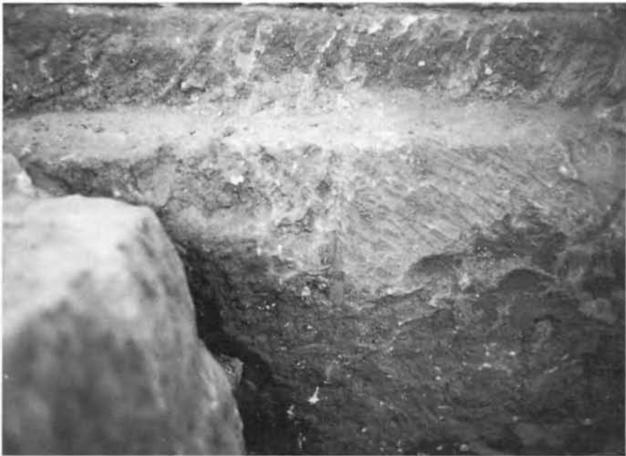
2. Détail de la retaille de l'assise supérieure des fondations de Thoutmosis I.