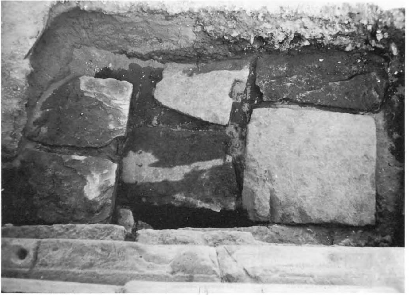
Pl. II. 1. Dalles de fondation de la "cour de fêtes" de Thoutmosis II contre les fondations de Thoutmosis I. (Cl. Th. Zimmer).