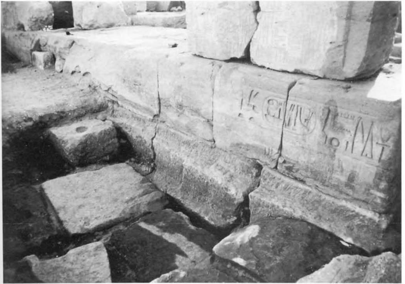
Pl. III. 1. Inscription de Ramsès IV, usurpée par Ramsès VI, au nord le bloc erratique de Thoutmosis IV (?).