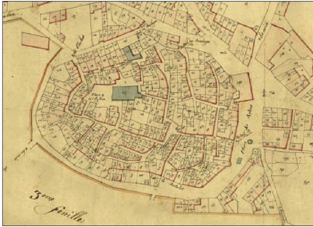
Fig. 3 : Le village de Saint-Cannat, cadastre de 1836

de Marseille se déplace souvent et sa demeure saint-cannadenne n'est qu'une étape parmi d'autres. Sans doute dès l'épiscopat d'Adémar Ameilh, il a acquis ou loué une maison à Avignon, signalée en 1343 103 . Pour sa part, Guillaume Sudre (1361-1366) fréquente volontiers une autre résidence rurale, le château de Signes, mentionné dès le début du XIV e siècle 104 . Le séjour du Beausset paraît plus précocement encore, au milieu du siècle précédent 105 . Situées dans le diocèse, mais à l'est de la cité, ces deux forteresses proches caractérisent des demeures de plaisance, sans doute hivernales, en des lieux où le prélat exerce de hautes juridictions confirmées par Charles d'Anjou en 1257.