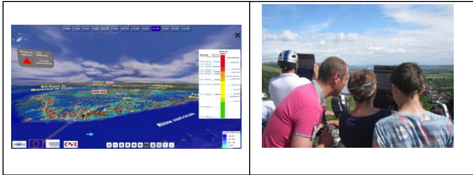
Figure 1. A gauche, visuel du premier type ; à droite exemple d'utilisation sur site (simulation située).

visualisations comme des dispositifs techno-sémiotiques, agencement d'éléments objectifs visant une performance sémiotique et cognitive (Verhaegen, 1999).