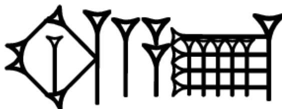
Fig. 3 : Le signe KAR KID « prostituée »

Cet extrait peut être mis en relation directe avec un conseil de sagesse : « N'épouse pas une prostituée ( harimtu ), dont les maris sont nombreux ! ». Ce texte sapientiel indique également les conséquences négatives d'un tel mariage : la nouvelle épouse ne supportera pas son mari durant les temps difficiles... (Lambert 1996 102, l. 72). Un mariage avec une telle femme serait donc le signe avant-coureur de malheurs. Le terme KAR.KID/ harimtu reste cependant difficile à cerner (cf. Glassner 2002 ; pour la prostitution en général, voir Cooper 2006).