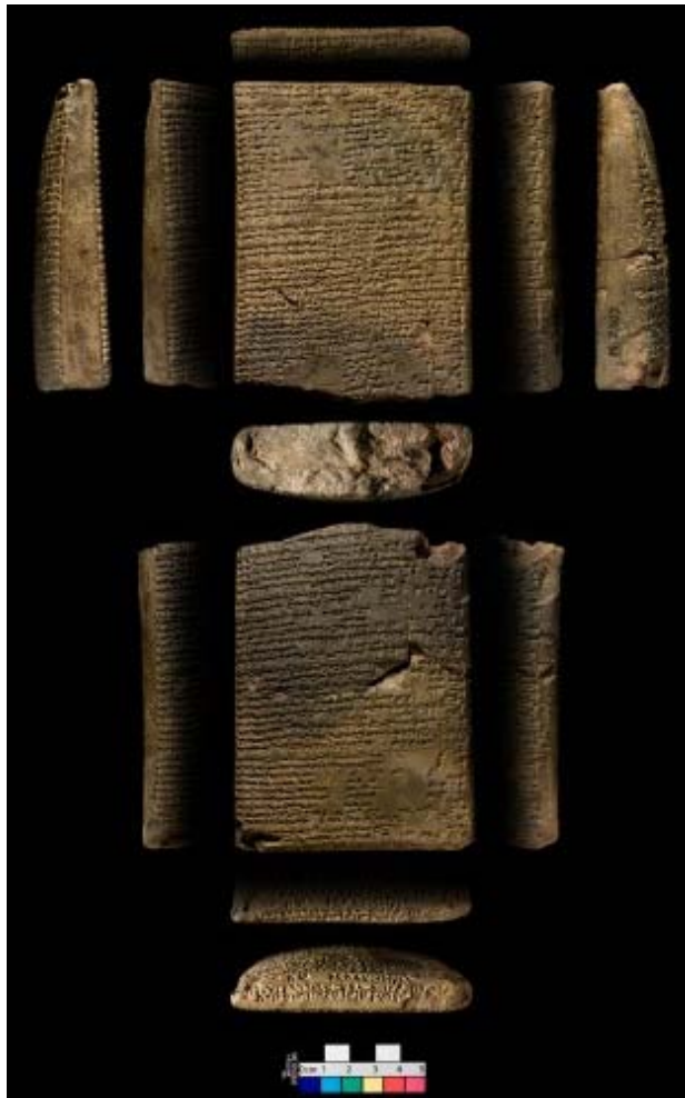
Fig. 1 : Photographie d'une des tablettes du š. ālu – CT 38 9-13