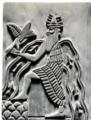
Fig. 4 : Représentation du dieu Ea, avec des eaux et des poissons jaillissant par-dessus ses épaules (Black et Green 1992 : 75)

L'analyse des comportements sexuels mentionnés dans les présages, notamment dans les tablettes 103-104 du šumma ālu , a déjà donné lieu à plusieurs articles d'A. K. Guinan (1997, 2001 et 2009). J'aimerais toutefois signaler ici un passage intéressant : le sexe selon le lieu. Deux situations sont envisagées. La première concerne les relations se déroulant en milieu aquatique : « Si quelqu'un a des relations sexuelles avec une femme dans une rivière (DIŠ ina I 7 ana MUNUS TE-hi) » ou encore « dans un bateau (ina GIŠ.MA 2 ) ». Dans les deux cas, l'apodose indique la même interprétation : « (C'est) un péché contre Ea ( ikkib d E 2 -a) » (Moran 1977, l. 1-2). Le choix du dieu impliqué s'explique aisément puisqu'Ea était la divinité des eaux douces. Il est cependant plus difficile de définir en quoi ces accouplements relèvent du tabou.