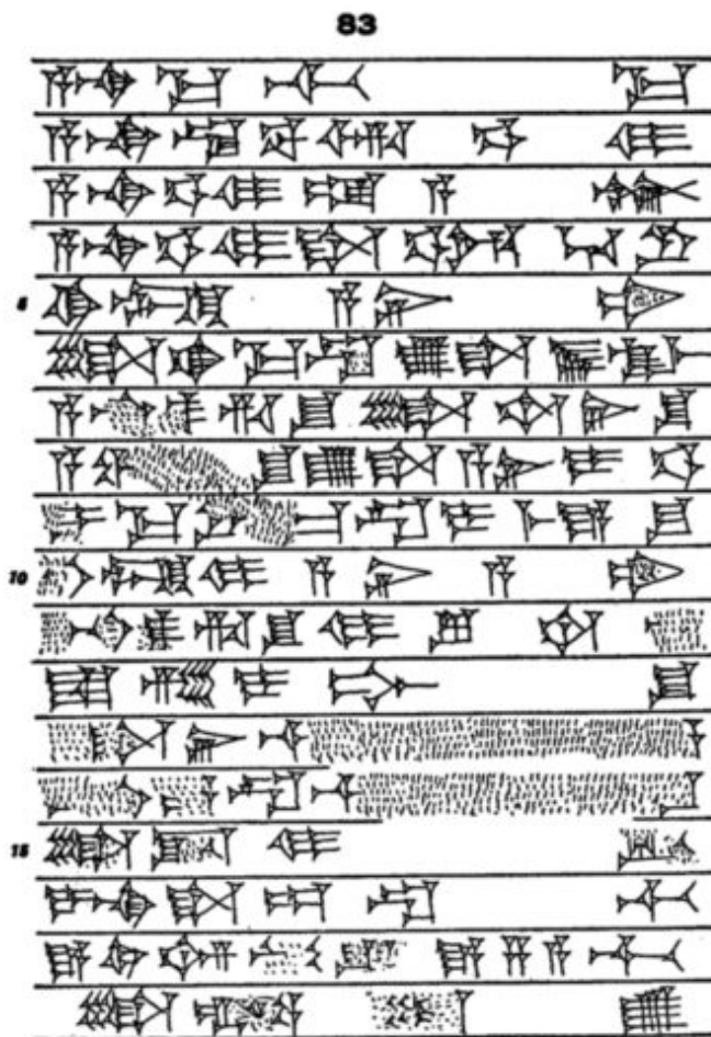
Fig. 5 : YOS IX 83, un des duplicatas de VAS I 54