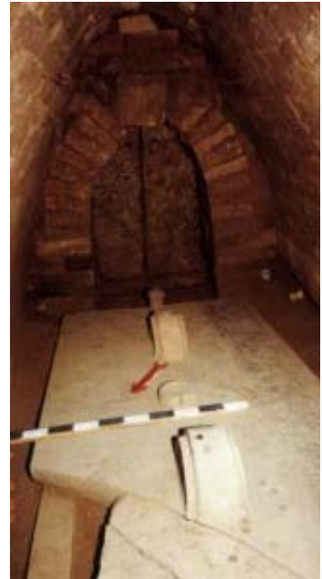
Fig. 2 : Couvercle inscrit du sarcophage de la reine Mullissu-Mukannišat-Ninua

(Tombe) de M[ullissu-Mukannišat-Ninua], reine d'[Aššumaširpal (II), roi d'Assyrie...] (et) [mère?] de Salma[nazar, roi d'Assyrie]. Inscription de Mullissu-Mukannišat-Ninua, l. 1-3