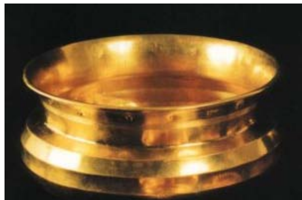
Fig. 6 : Bol inscrit découvert dans une tombe à Nimrud ©

En somme, les inscriptions funéraires sont rares et variées, mais elles ont pour vocation de désigner les défunts, afin de perpétuer leur nom, et surtout d'attirer l'attention sur leur préoccupation commune, à savoir le respect des sépultures, notamment au moyen de malédictions.