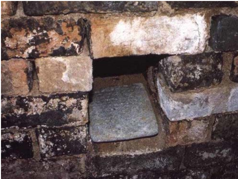
Fig. 4 : Tablette découverte dans une niche de la tombe de Yabâ