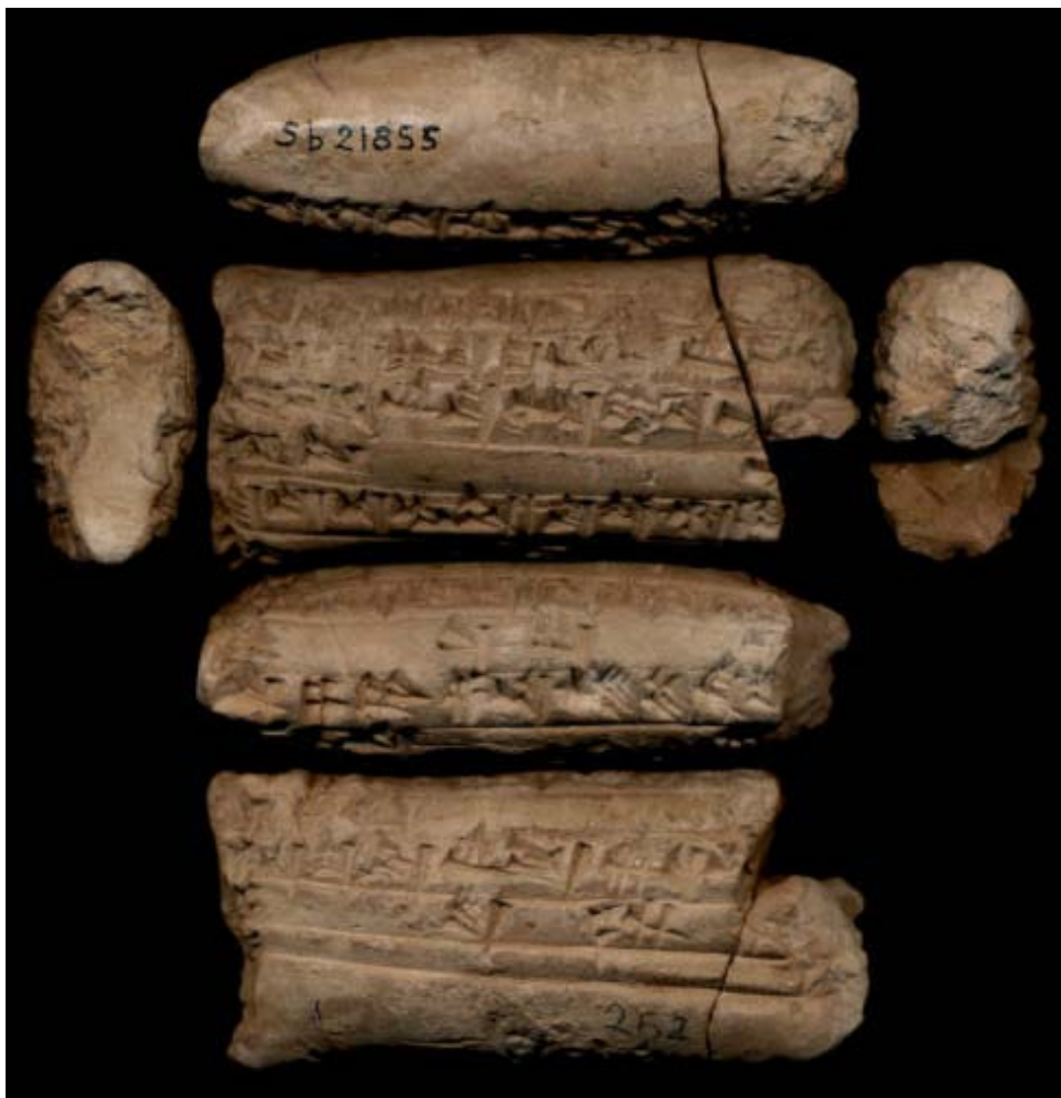
Fig. 1 : Photographie de la tablette MDP 18 252

Ce corpus peut être divisé en deux catégories : des textes désignant directement la tombe et/ou son occupant, et des inscriptions « simples » comportant seulement des noms propres, parfois accompagnés de titulatures.