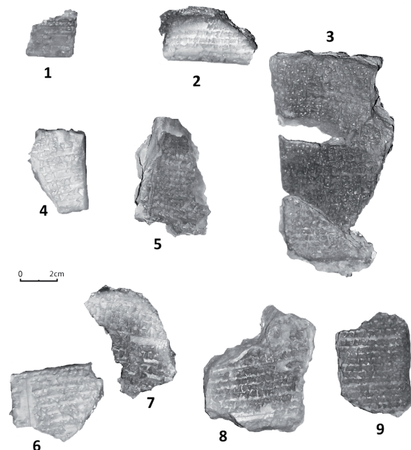
Figure 3: Les neuf fragments (Mish. 235, musée d'Alep, © V. Muller).