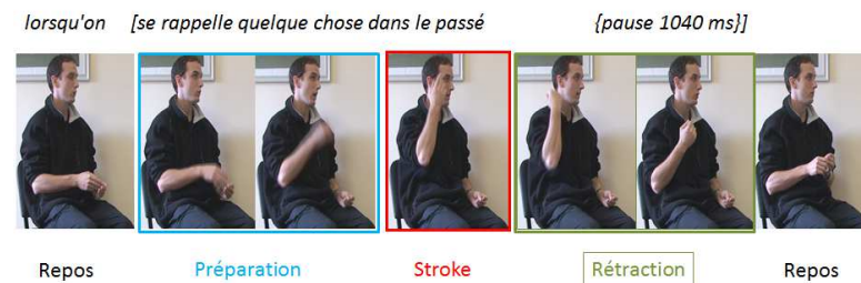
Figure 2 : Découpage du geste (d'après McNeill, 1992: 83)

le stroke qui est le point culminant du geste (le moment le plus signifiant) et la rétraction lorsque les mains reviennent à leur position initiale. Bien sûr, il s'agit ici d'un exemple de geste isolé. Les gestes peuvent s'enchaîner et dans ce cas, les phases de préparation ou de rétraction peuvent être superflues.