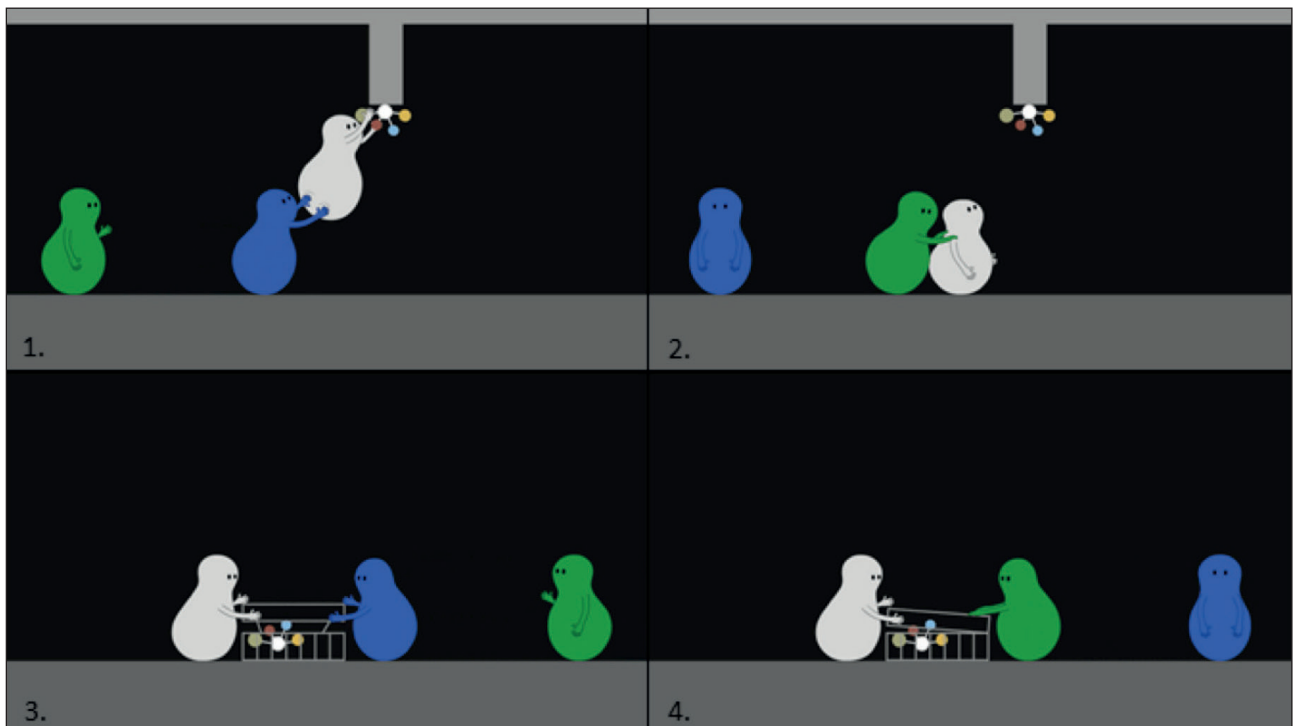
Figure 1. Illustrations des scénarii sociaux des situations d'aide (images 1 et 2) et de coopération (images 3 et 4) L'image 1 correspond à l'action d'aide du personnage prosocial et l'image 2 à l'action d'entrave du personnage antisocial dans la situation « aide ». L'image 3 correspond à l'action d'aide du personnage prosocial et l'image 4 à l'action d'entrave du personnage antisocial dans la situation « coopération ».

Lors de la présentation des personnages à la fin de la séquence, pour chacune des mesures relevées, aucune différence significative n'a été observée entre le personnage prosocial et antisocial dans les deux situations (aide