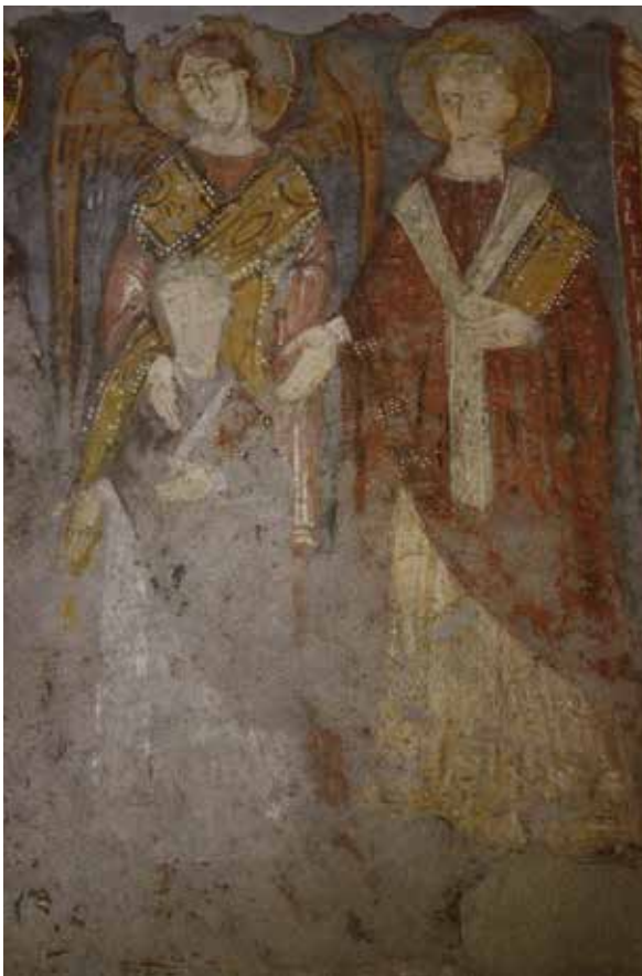
5. Affresco del XI secolo con Commendatio animae , dettaglio. Roma, San Clemente, chiesa inferiore, narcece.