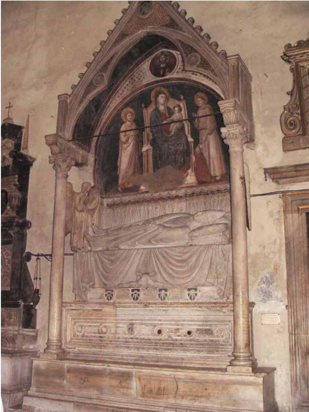
1. Tomba del cardinale Matteo d'Acquasparta († 1302). Roma, Santa Maria in Aracoeli, particolare del braccio sinistro del transetto.