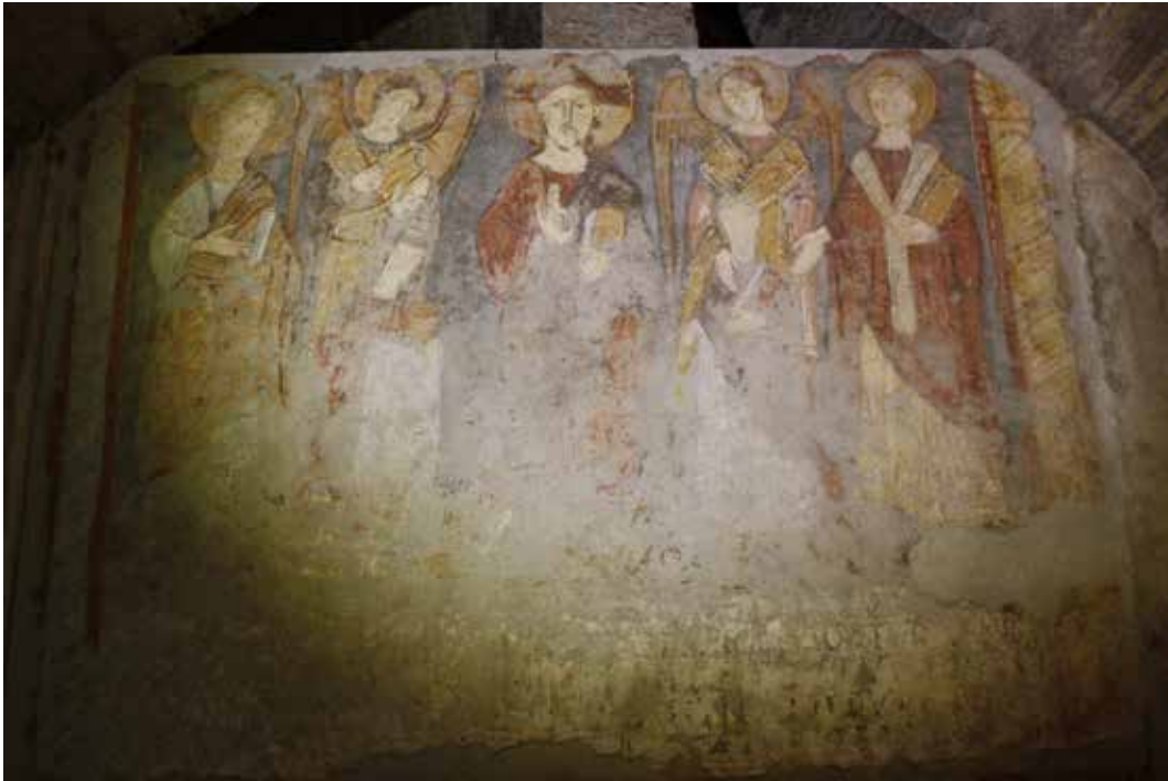
4. Affresco del XI secolo con Commendatio animae . Roma, San Clemente, chiesa inferiore, narcece.