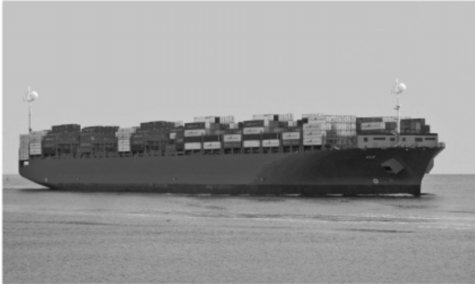
Figure 1 : Exemple de NCT

Le projet achevé aujourd'hui du Maritime Unmanned Navigation through Intelligence in Networks (MUNIN) cofinancé par l'Union européenne dans le cadre du 7 e PCRD est plus ambitieux que le NCT. Le concept est celui du navire autonome sans officier de quart, piloté par une organisation automatisée de la décision, surveillé par un contrôleur à terre. Bien que les conclusions du consortium MUNIN soient positives, elles soulèvent des problèmes qui sont loin d'avoir une solution opérationnelle, dont le principal est de savoir à partir de quel moment, le navire MUNIN va éveiller l'attention du contrôleur sur signal faible 6 dans un cas d'espèce comme celui évoqué ci-dessus.