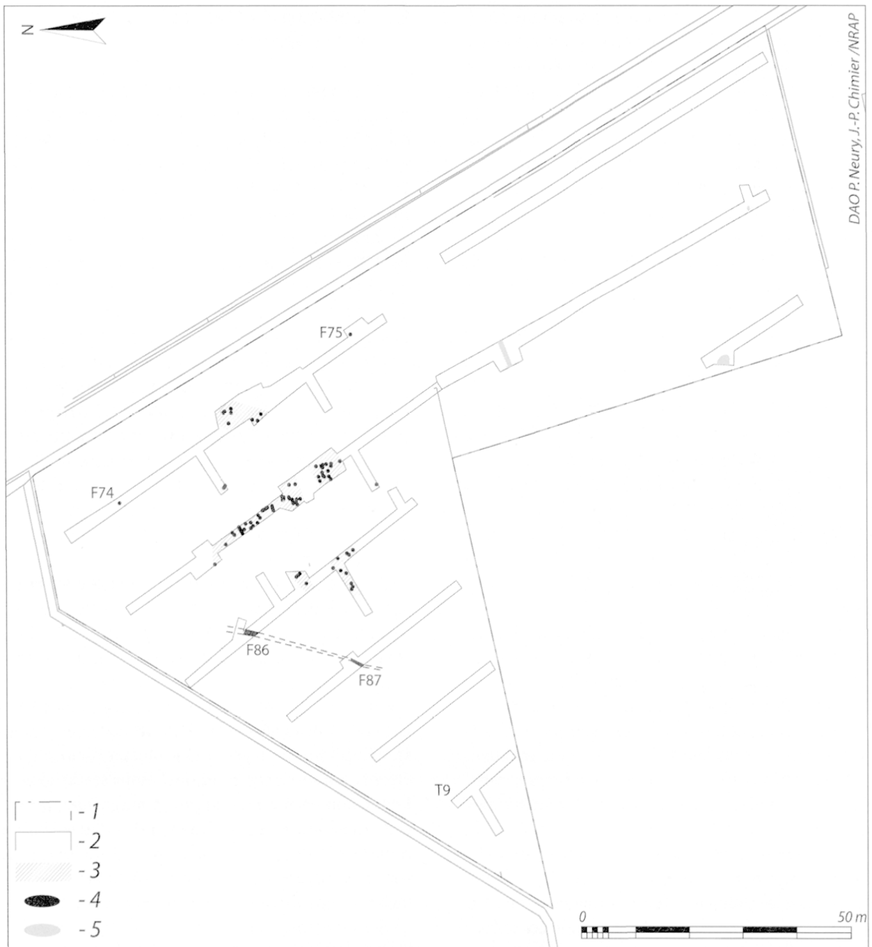
Fig. 2 : Plan général (1/1000°). 1- Limites d'emprise de l'évaluation; 2 - Tranchées; 3 - Nécropole à incinération; 4 - Structures archéologiques antiques; 5 - Structures archéologiques modernes.

la nécropole. La présence de mobilier antique issu du fossé étaye cette hypothèse même si la céramique peut être résiduelle.