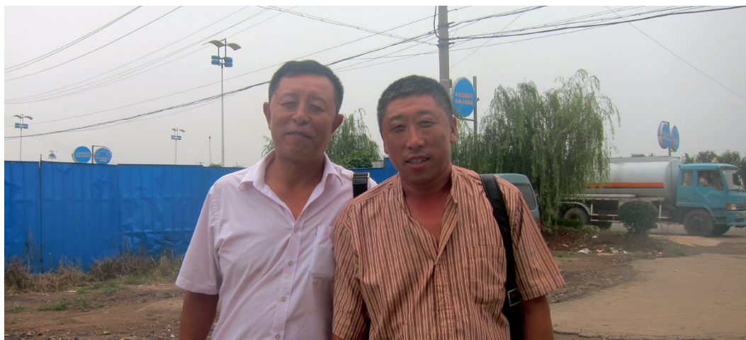
2. Un professeur d'université et son cousin aquaculteur travaillant sur la « 4 e révolution aquacole », fortement encouragée par le gouvernement chinois et les autorités provinciales dans le cadre du plan de développement de l'« économie bleue », Hebao, août 2011

En 2011, année clémente sur le front des échouages d'algues, ni le ballet des tractopelles et des camions-bennes, ni celui des algues vertes ne semblent gêner les dizaines de millions de touristes qui fréquentent les plages. Cette situation frappe beaucoup les observateurs étrangers et donne lieu à la publication, sur les réseaux sociaux comme dans la presse, de nombreuses photographies: les