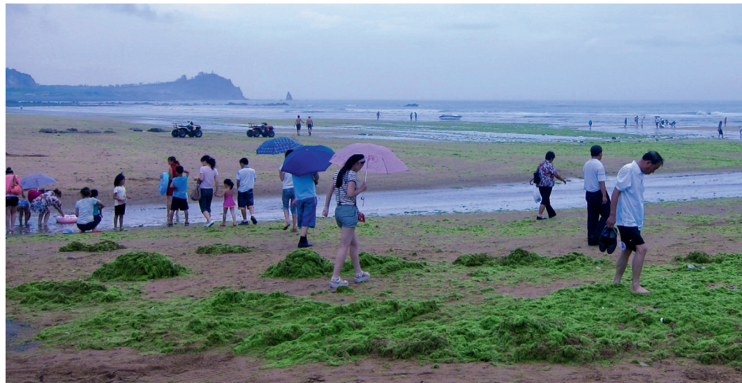
5. Jour de pluie. Old Stone Man Beach, Qingdao, août 2011

Ce n'est qu'au terme de mon séjour, à l'occasion des dîners d'adieu, qu'émergeront dans l'entourage de mes hôtes, des évocations inquiètes de la stratégie du gouvernement à ce sujet. Les convives sont principalement des hommes qui occupent des postes de direction dans des entreprises et des administrations, et entretiennent des liens étroits avec le parti communiste chinois. Ils oscillent entre deux postures : la première les incite à la prudence dans l'expression vis-à-vis d'une étrangère. Ils me questionnent de façon indirecte sur mes intentions, et de façon beaucoup plus directe sur le regard que portent les Occidentaux sur la Chine, répondant très rarement aux questions que je risque. Une fois que j'ai longuement évoqué avec eux les difficultés que j'observe sur mon terrain principal d'enquête en France et le fait que les proliférations d'algues sont observées dans de nombreux endroits du monde, y compris en Europe et en Amérique du Nord, la discussion devient plus libre. Nous parlons alors de changement, et de complexité. Ils peuvent s'étonner et rire de ce qui se passe au moment où nous parlons, en Bretagne : la découverte progressive des cadavres d'une harde de sangliers morts dans un petit estuaire envahi d'algues vertes. Ce feuilleton