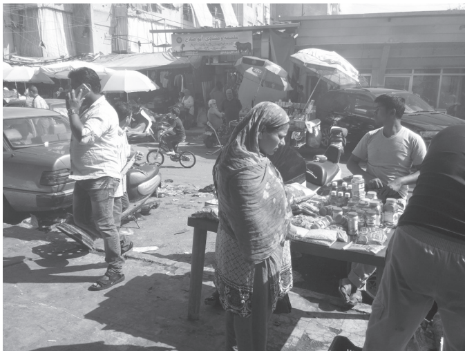
Le marché de Sabra

Dans cette ville, le quartier de Sabra, avec son marché qui génère une importante activité commerciale, constitue un point d'ancrage pour de nombreux Syriens. Sabra représente plus généralement un véritable carrefour des mobilités, un filtre sensible des trajectoires internationales passées au tamis de ses ressources et de son informalité.