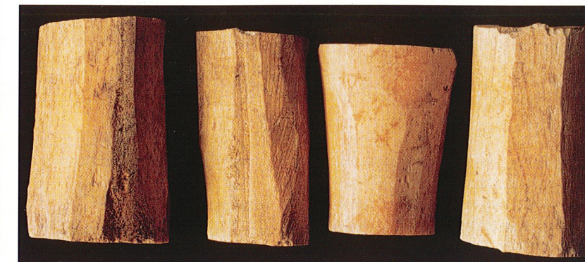
Figure 3 : quelques matrices dégrossies.