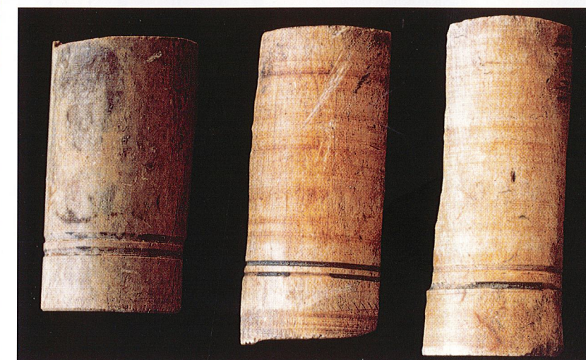
Figure 4 : charnière avant polissage (des traces laissées par le travail au tour sont encore visibles).