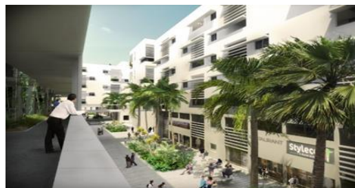
Image virtuelle (IAO) / vue diagonale intérieure de la vie au sein de l'éco-quartier Diar El Djenane d'Alger.