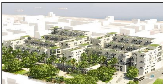
Image virtuelle en 3D du projet / vue panoramique

Pour résumer, depuis plus de trente ans, les villes algériennes ont été le terrain d'expérimentation de différentes politiques d'habitat et de logement. Le dispositif quartier durable et abordable en est un autre exemple, même si celui-ci se veut « innovant » en matière des modes d'appropriation et « d'habiter » la ville. 21 Innovation qui n'est pas, tout à fait, désencastrée des processus de métropolisation et de moyennisation à l'œuvre à l'heure.