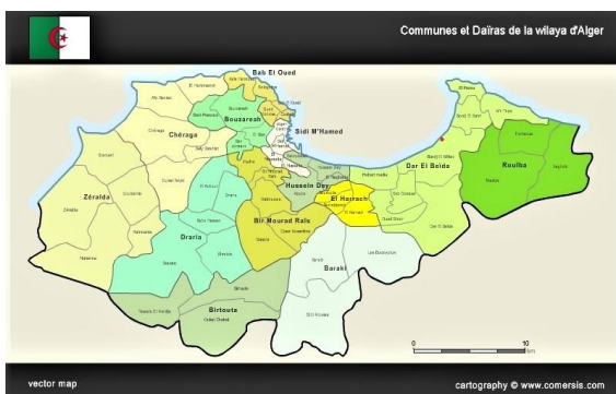
Carte : Localisation du site qui accueillera le projet d'éco-quartier Diar El djenane d'Alger dans le cadre de la politique d'habitat durable et abordable. (L'endroit est indiqué sur la carte par un point rouge. Source :

Dans la métropole algéroise, le déclenchement de ce processus est identifiable au travers les investissements lourds dans des grands équipements touristiques, sportifs et de loisirs comme le Kiffan club, l'aquafortland et le Centre commercial et de loisirs Bab Ezzouar. Mais, cela est particulièrement perceptible dans la stratégie du redéveloppement « durable » du Grand Alger annoncée par les collectivités territoriales dans le cadre du nouveau PDAU 2012-2035. Ce dernier prône l'extension de la ligne du métro Alger jusqu'à Dergana ; l'ouverture d'une nouvelle voie rapide (2 × 2 voies) au sud de la commune pour relier plus vite les communes balnéaires excentrées du nord-est de la wilaya au reste de l'agglomération d'Alger ; le réaménagement de la baie d'Alger et enfin la création d'éco-quartiers.