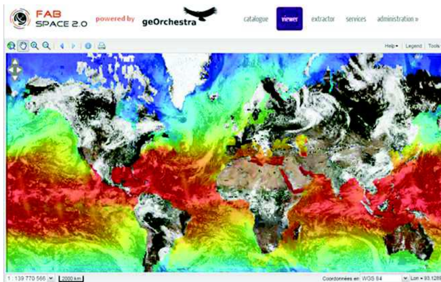
Figure 2 : Affichage de données spatiales (température des océans) sur la plateforme FabSpace déployée au sein de l'université d'Athènes (Grèce)

L'utilisation de données spatiales, et notamment les données d'observation de la Terre est un levier de croissance important pour le développement de services dans de nombreux domaines d'application tels que les transports, l'agriculture, l'aménagement du territoire ou les énergies.