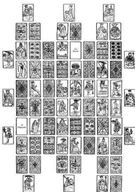
Illustration 1: Le Château des destins croisés