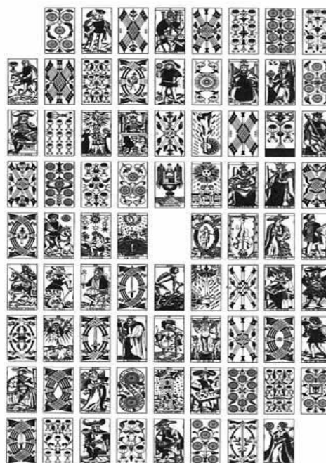
Illustration 2: La Taverne des destins croisés

Le lecteur a accès au plan et au « mots croisés » de tarots : mais l'information y est tellement condensée que ces représentations ne facilitent pas la lecture. Plutôt pourrait-on dire que le texte apparaît comme l'explicitation du système contenu dans le schéma, dans la carte.