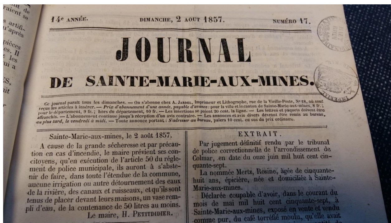
Figure 1 : Extrait du Journal de Sainte-Marie-aux-Mines du 2 août 1857

Lors d'épisodes sévères, prières et processions peuvent être entreprises pour faire pleuvoir. Nous n'en avons trouvé que de faibles mentions en Alsace, comme en 1780 où un journal anonyme indique : « Août beau et très chaud. La sécheresse a duré depuis la Pentecôte jusqu'au mois de septembre, à l'exception de quelques petits orages. On ne se souvient pas d'une sécheresse aussi longue. On a fait partout des prières publiques. La vendange bonne pour la quantité et excellente ; pour la qualité » [dans Kuény, 1903]. Mais peu à peu, « le besoin de protection contre les intempéries s'est laïcisé au cours des siècles - le contrat d'assurance remplaçant la prière collective » [Brodu, 1990, p. 92].