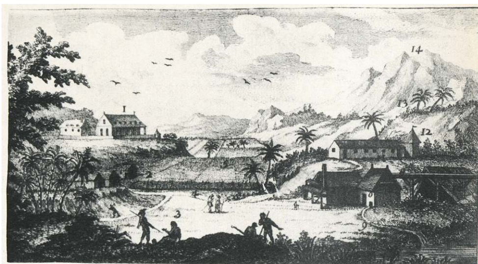
PLANCHE VIII. Plan d'une " habitation " aux Antilles. Gravure du XVIII e siècle.