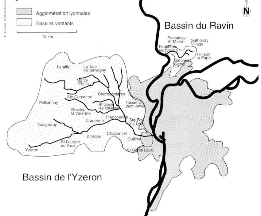
Figure 1 : Plan de situation

échantillon, est composé de cadres intermédiaires et supérieurs habitant sur place depuis moins de cinq ans. Nous observons le même phénomène de gentrification le long du Ravin. Toutefois, cette tendance ne doit pas occulter que, pour nombre de riverains rencontrés, c'est à leur statut de propriétaire qu'ils doivent leur position sociale davantage qu'à leur statut professionnel. Autrement dit, la question de la valorisation et de la dévalorisation foncière revêt une importance particulière pour les personnes interrogées.