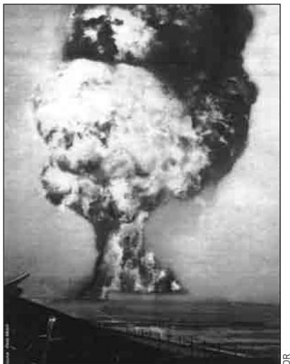
La raffinerie de Feyzin le 4 janvier 1966 dans Paris-Match , qui qualifia le panache de fumée de « champignon d'Hiroshima ».

rique 7 permet en effet de mobiliser le passé afin d'aider à la compréhension des lignes de force qui structurent le présent, par l'identification, sur la moyenne et la longue durée, de dynamiques sociales et spatiales susceptibles d'influer sur les modes de perception, d'identification et de traitement du risque.