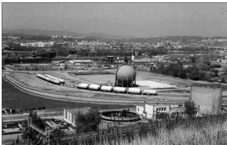
DR Le risque, catastrophe virtuelle : la sphère de stockage de chlorure de vinyle monomère ou CVM, produit hautement inflammable et toxique, aujourd'hui sur le site d'Atofina (Saint-Fons).

une fois pour toutes 15 mais actualisées en permanence, susceptibles d'évolution aussi bien dans le temps long (de la vie ou d'un morceau de vie) que dans le temps court (de la rencontre avec l'enquêteur par exemple). Le propos oscille souvent entre un pôle positif (la sécurité absolue) et un pôle négatif (la catastrophe, l'accident), comme soumis à une différence de potentiel . Parce que