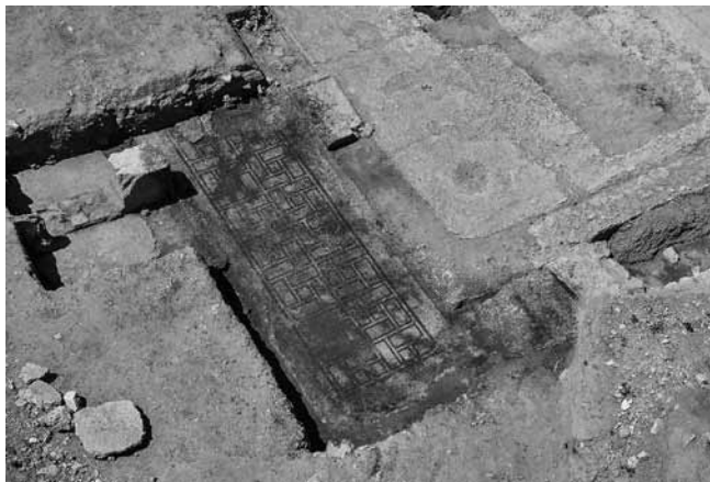
Fig. 106 – ARLES, Verrerie. Mosaïque géométrique SL343 du couloir XXII ouvrant au nord sur le triclinium de l'Aiôn (X). Vue prise de l'est.

À la fin du II e s. p.C., le secteur est remodelé et accueille la domus dite de l'Aiôn dont le plan a été complété grâce à la réalisation de sondages portant sur les couloirs ouest (XIV) et sud (XXII) s'ouvrant sur le triclinium (X). Ces couloirs comportent des sols mosaïqués employant une même trame constituée d'une composition orthogonale de carrés adjacents (fig. 106). Des précisions ont été apportées sur la constitution du support de la mosaïque de l'Aiôn et sur la date de sa mise en place puisque le