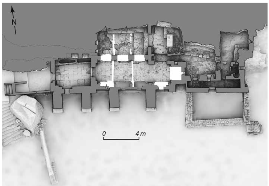
Fig. 107 – ARLES, ermitage Saint-Pierre de Montmajour. Plan de l'ermitage (au scanner 3d, en cours de finalisation) (O. Veissière, Patrimoine numérique).

est bordé de deux séries de trois arcs retombant sur des colonnes à chapiteaux au sud et au nord de piles intégrant des colonnes similaires s'ouvrant sur le vaisseau septentrional (fig. 109).