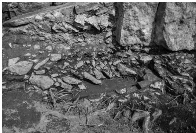
Fig. 102 – ARLES, Rempart. La sépulture bâtie comblée de blocs de calcaire.

• Sous ce premier aménagement, la coupe résultant de l'arrachage d'une souche a révélé une sépulture bâtie (fig. 101). Celle-ci a été construite dans une fosse creusée dans le rocher. Les parois et le fond sont constitués de briques liées au mortier de tuileau. L'ensemble des surfaces internes a été enduit de mortier de tuileau. L'extrémité ouest et le sommet de la structure ont été amputés par les terrassements réalisés pour l'édification du soubassement tardo-antique. La tombe a alors été totalement vidée et remplie de blocs de calcaire disposés