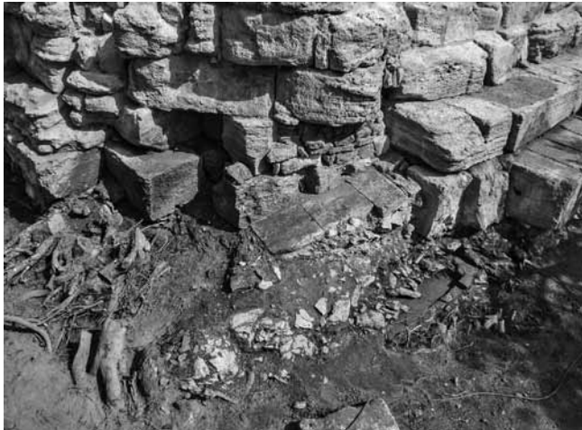
Fig. 101 – ARLES, Rempart. Angle sud-ouest de la tour, dallage du fond de la canalisation médiévale et, en dessous, la sépulture bâtie.

• La canalisation médiévale a été percée à l'angle sud-ouest du soubassement de la tour tardo-antique construite en grands blocs de remploi (fig. 101).