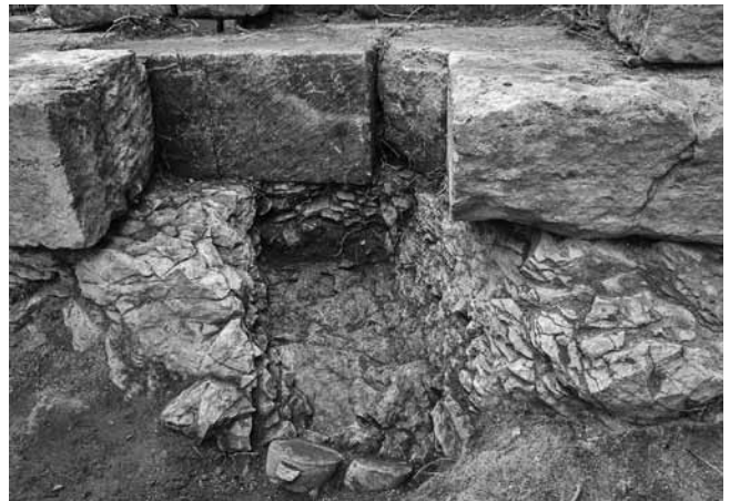
Fig. 103 – ARLES, Rempart. Fosse de la sépulture découverte sous les fondations de la face est de la tour.

• Au pied de la façade est de cette même tour a été découverte une seconde sépulture. Seule sa moitié ouest est conservée. Elle était comblée de terre et recouverte par l'un des blocs constituant la première assise de la tour tardo-antique (fig. 103). La fosse, creusée dans le rocher, a reçu un seul individu adulte reposant en décubitus dorsal la tête à l'ouest. Le crâne avait disparu. Deux clous découverts à l'extrémité ouest de la tombe pourraient se rapporter à un cercueil mais aucune observation archéothanatologique ne vient le confirmer. L'inhumation n'était accompagnée d'aucun mobilier.