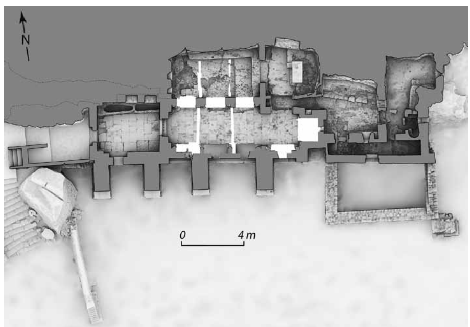
Fig. 107 – ARLES, ermitage Saint-Pierre de Montmajour. Plan de l’ermitage (au scanner 3d, en cours de finalisation) (O. Veissière, Patrimoine numérique).

est bordé de deux séries de trois arcs retombant sur des colonnes à chapiteaux au sud et au nord de piles intégrant des colonnes similaires s’ouvrant sur le vaisseau septentrional (fig. 109).