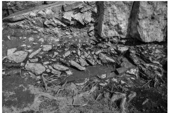
Fig. 102 – ARLES, Rempart. La sépulture bâtie comblée de blocs de calcaire.

• Sous ce premier aménagement, la coupe résultant de l'arrachage d'une souche a révélé une sépulture bâtie (fig. 101). Celle-ci a été construite dans une fosse creusée dans le rocher. Les parois et le fond sont constitués de briques liées au mortier de tuileau. L'ensemble des surfaces internes a été enduit de mortier de tuileau. L'extrémité ouest et le sommet de la structure ont été amputés par les terrassements réalisés pour l'édification du soubassement tardo-antique. La tombe a alors été totalement vidée et remplie de blocs de calcaire disposés