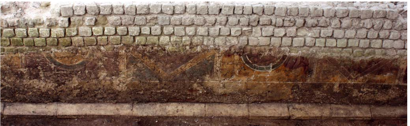
Abb. 3: Décor en place sur le mur de galerie du forum de Vieux