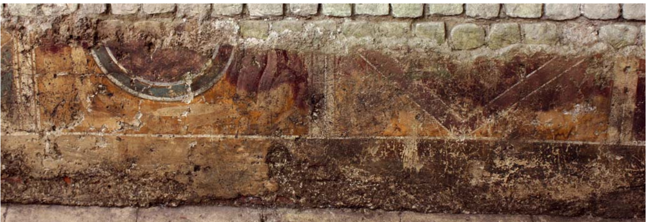
Abb. 4: Détail du décor de la galerie du forum de Vieux