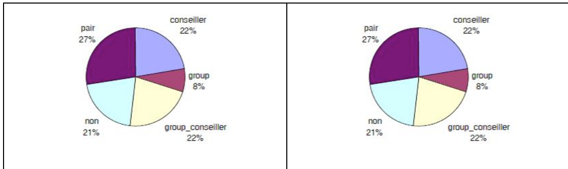
Figure 2: Répartition dans notre échantillon des modalités des variables « interactions avec autrui » dans la phase de mise en alerte (à gauche) et dans la phase d'expérience (à droite)

Légende : group : groupe de développement agricole ; groupe_conseiller : conseiller intervenant dans un groupe de développement ; non : pas d'interaction avec autrui. Pour plus de détails, voir la description des modalités dans le tableau 2.