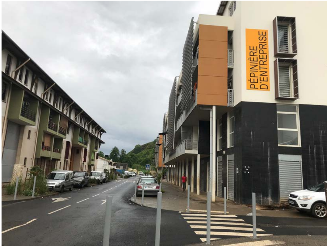
Fig. 10 : Nouveaux bâtiments dans le quartier de M'Gombani

Cette photo nous montre le nouveau paysage dans le quartier de M'Gombani avec ses bâtiments de type immeuble. Une architecture massive, assez éloignée de l'habitat individuel des cases traditionnelles, des cases SIM et maisons LATS (C. Remou, décembre 2017).