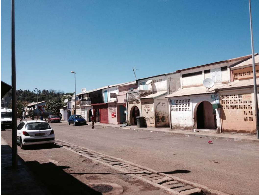
Fig. 2 : Type d’habitat dans le quartier de M’Gombani avant la Rénovation Urbaine

Cette photo a été prise dans le quartier de M’Gombani dans la commune de Mamoudzou. Elle montre comment était le quartier avant l’opération de rénovation urbaine et le type d’habitat qui y existait. Le caractère de délabrement avancé justifie l’opération d’aménagement (C. Remou, 2014).