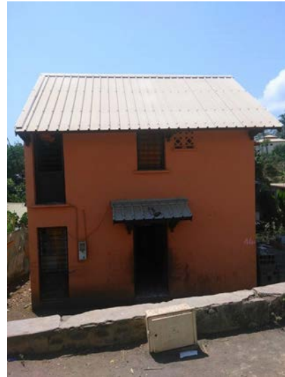
Fig. 9 : Logement en Accession Très Sociale (LATS)

Les Logements en Accession Très sociale (LATS) sont un nouveau dispositif mis en place en 2006 et qui remplacent les cases SIM ne répondant plus aux exigences de la population. Ce dispositif propose une maison plus grande et plus spacieuse avec cuisine et toilettes intégrées à l’intérieur. Cette photo a été prise à Majicavo Lamir dans la commune de Koungou. On voit la façade avant de la maison (C. Remou, 2017).