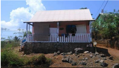
Fig. 8 : Case de la Société Immobilière de Mayotte

Un deuxième modèle, plus modeste, de case SIM des années 2000, deux pièces et des toilettes encore séparées de la maison. La photo a été prise à Majicavo Lamir dans la commune de Koungou.