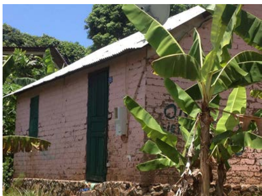
Fig. 6, 7 : Cases de la Société Immobilière de Mayotte

La photo nous montre un exemple de case SIM des années 1980. Elle se compose de deux pièces. Les sanitaires sont souvent dissociés de la maison. Les cases étaient faites en briques de terre compressée. Cette maison se trouve dans la commune de Kani-Kéli dans le sud de l'île (C. Remou, 2013).