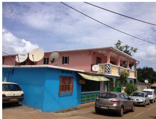
Fig. 5 : Maison contemporaine

La photo a été prise dans le village de Tsararano dans la commune de Dembeni dans le centre de l'île. On y observe les nouvelles constructions souvent à étage avec un confort qui n'a plus rien à voir avec celui que proposent les cases traditionnelles : toilettes et cuisines intégrées dans le corps du bâtiment, nombreuses chambres, etc. (C. Remou, 2013).