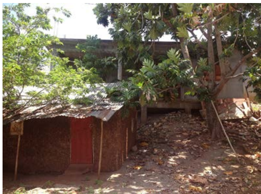
Fig. 4 : Case traditionnelle

La photo a été prise dans le sud de Mayotte dans le village de Passi-Kéli dans la commune de Kani-Kéli. Ce type d'habitat en terre était fréquent sur toute l'île. Il ne répond plus aux conditions de vie et de confort des Mahorais (C. Remou, 2013).