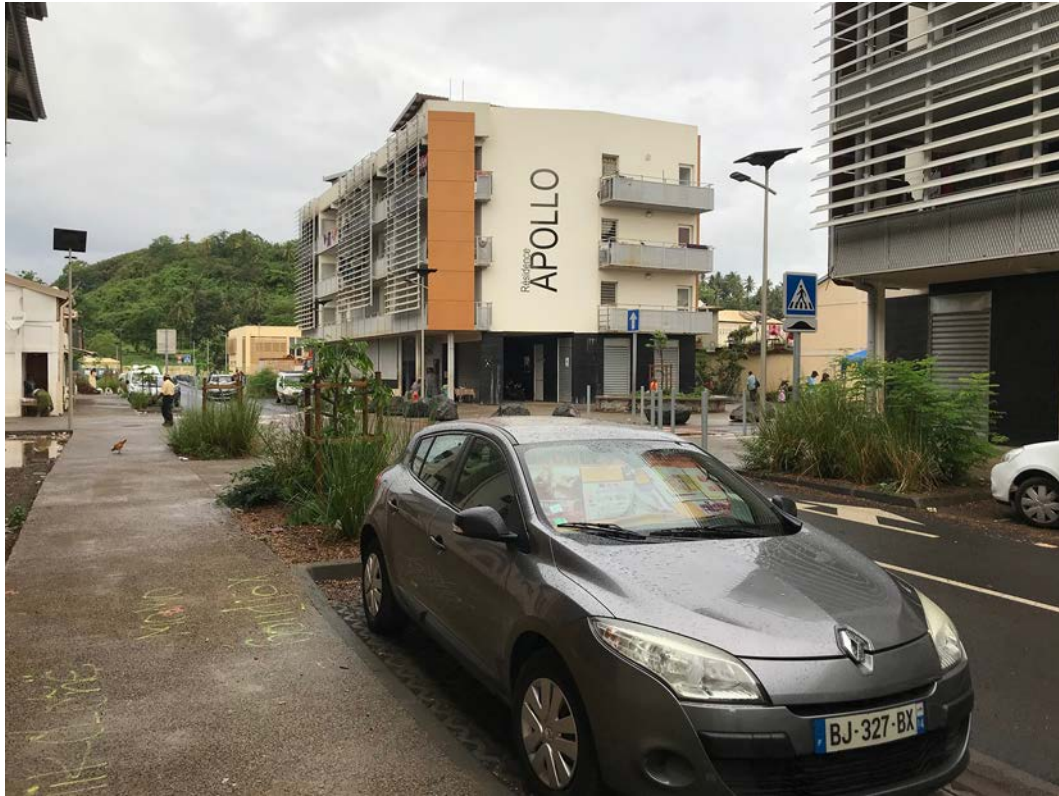
Fig. 11 : Bâtiments nés de la rénovation urbaine à M’Gombani

Cette photo nous montre les nouveaux bâtiments dans le quartier de M’Gombani dans la commune de Mamoudzou. Elle illustre la mutation profonde que connaît le quartier suite à l’opération de rénovation urbaine (C. Remou, décembre 2017).