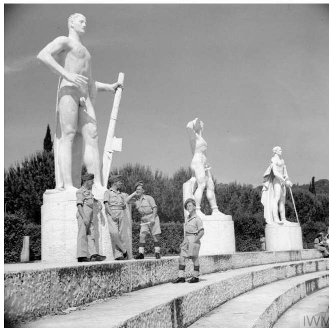
Figure 4b: Stade des marbres à Rome en 1944.