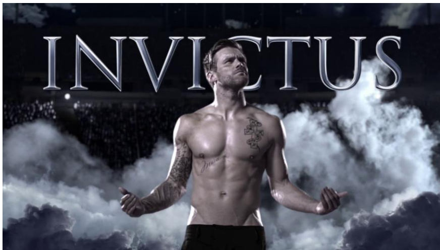
Figures 8a et b: Images extraites de la publicité Invictus (© Paco Rabanne2013).