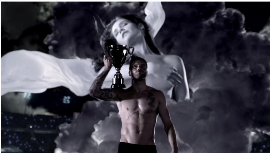
Figure 7f: Image extraite de la publicité Invictus.