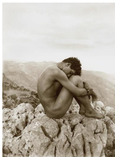
Figure 1: Photographies de Wilhelm von Gloeden (1856-1931).