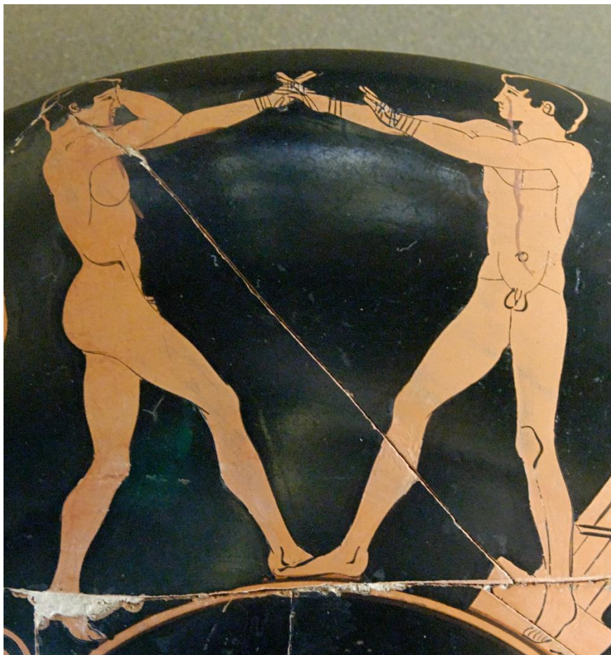
Figure 7d: Pugilistes en garde, coupe du Peintre de Londres E80, v. 470 av. J.-C., Musée du Louvre