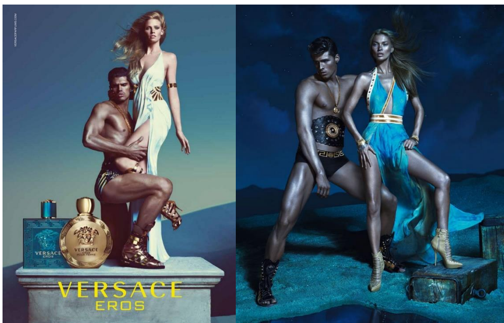
Figure 6b: Affiches pour Eros et Eros pour femme.