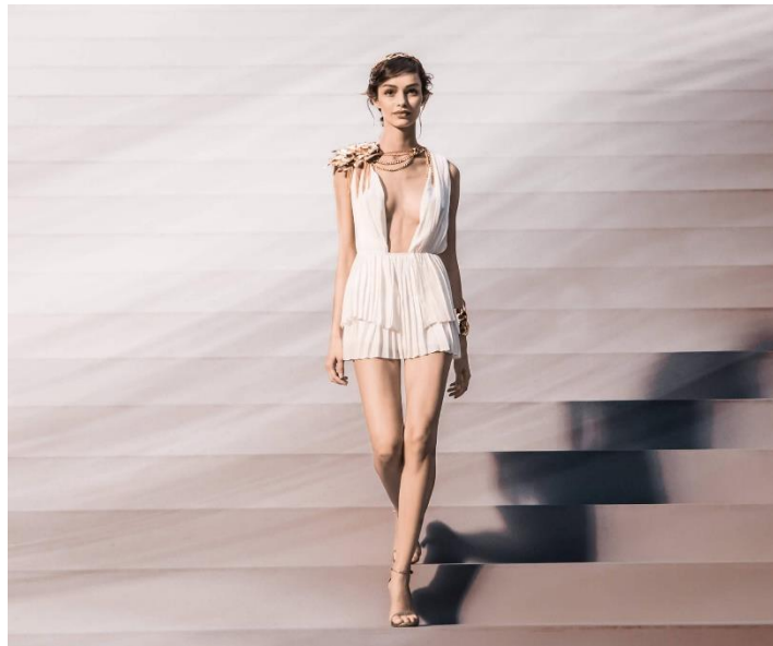
Figure 9b: Image extraite de publicité Olympéa.