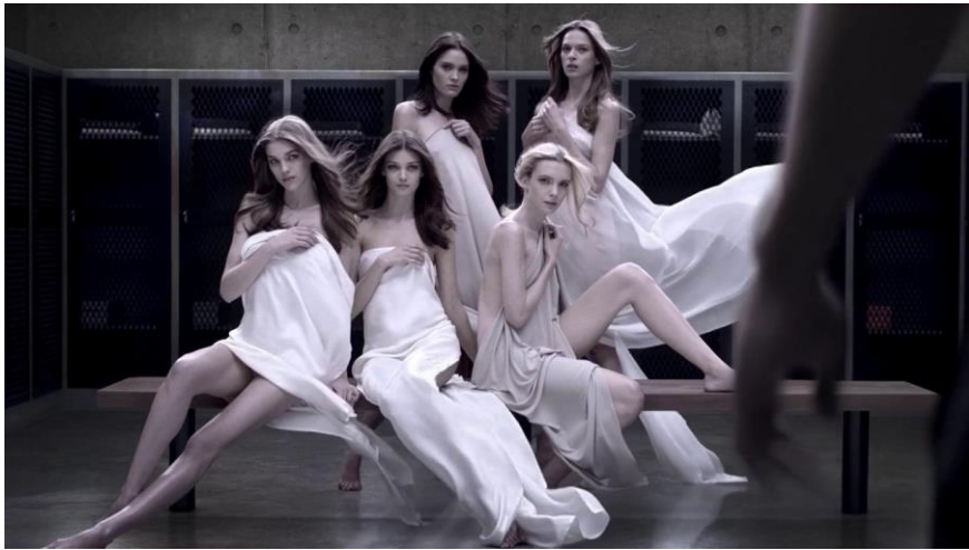
Figure 9a: Images extraites de publicité Invictus.