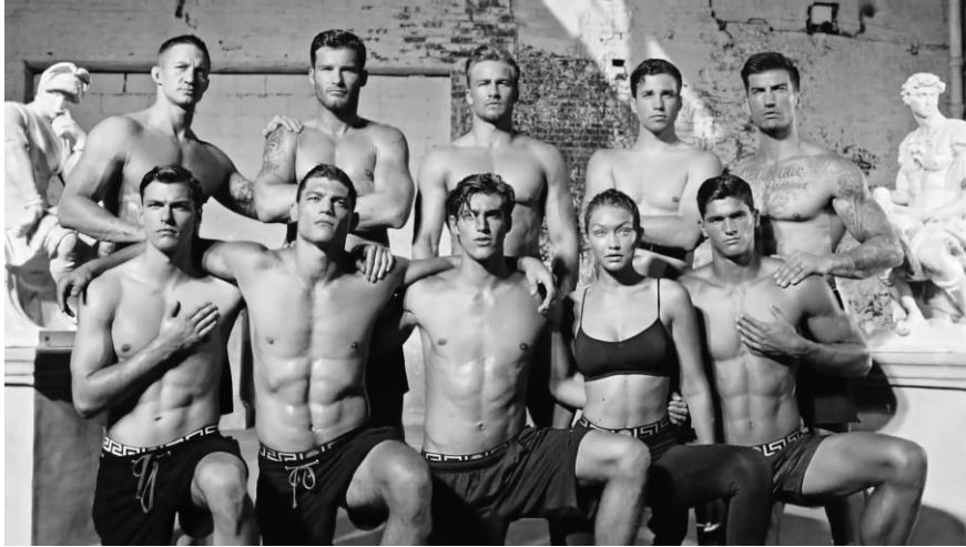
Figure 3a: Image extraite de la publicité Dylan Blue (© Versace 2016).