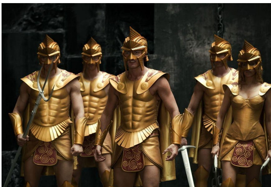
Figure 5a: Images extraites du film Les immortels (Tarsem Singh).