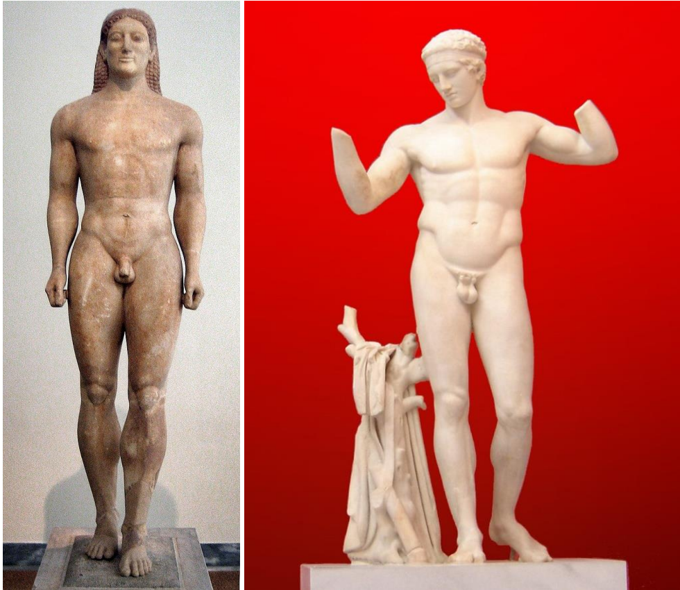
Figure 7a: Kouros d'Anavysos, VIe s. av J.-C., Musée national Archéologique d'Athènes