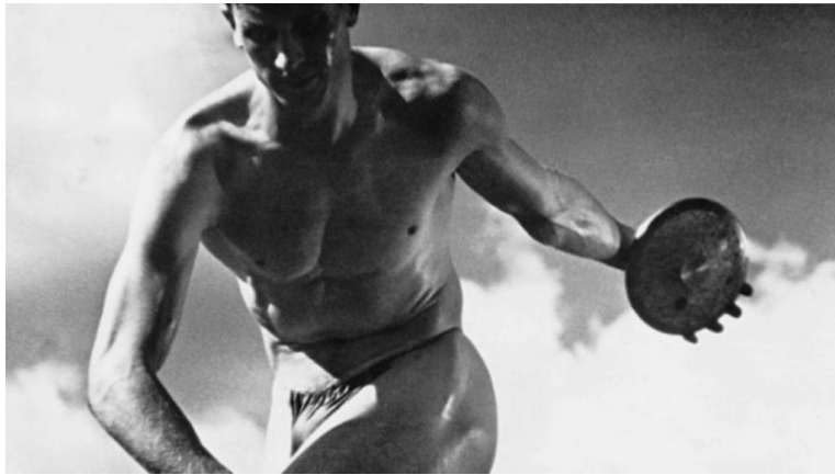
Figure 4a: Image extraite du film Les dieux du stade (Leni Riefenstahl, 1936).