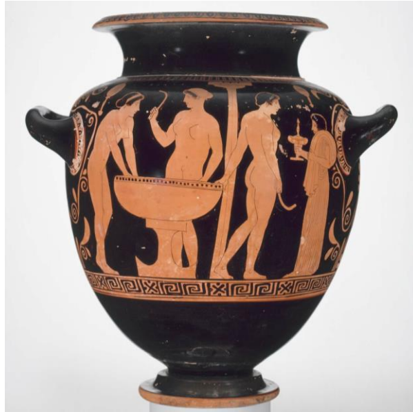
Figure 8c: Stamnos à figures rouges. Athènes, 440–430 av. J.-C., Groupe de Polygnotos : trois femmes se lavent au louterion après l'exercice. Une servante, habillée leur apporte des onguents et un vêtement (Museum of fine Arts of Boston, inv. 95.21 - www.mfa.org/collections/object/jar-stamnos-with-female-athletes-bathing-153881 ).