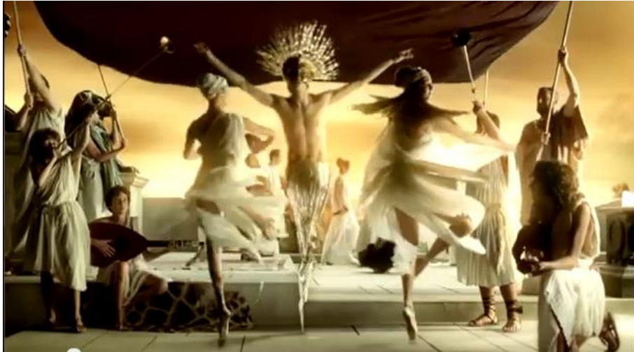
Figure 10: Image extraite de la publicité « Existence ».