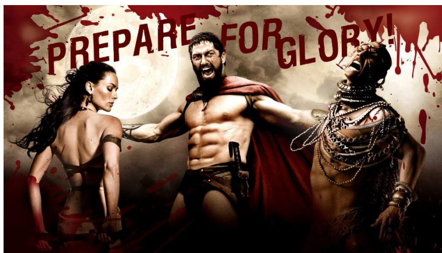
Figure 5c: Affiche pour le film 300 (Zack Snyder, © Warner Bros. Pictures 2007).