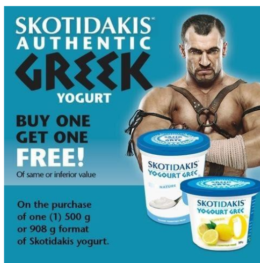
Figure 6c: Publicité pour les yaourts de la marque Skotidakis