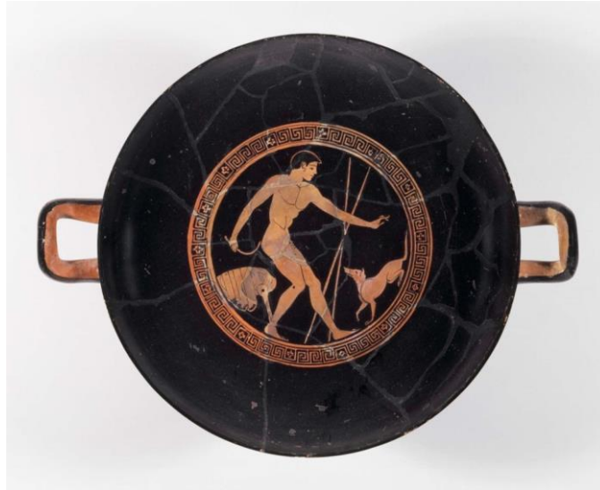
Figure 7e: Kylix à figures rouges. Athènes, vers 480 av. J.-C., Peintre de Brygos : jeune athlète nu avec un strigile, un chien, un sac et deux javelots. Museum of fine Arts of Boston, inv. 01.8038 http://www.mfa.org/collections/object/drinking-cup-kylix-depicting-an-athlete-cleaning-up-and-his-dog-153706