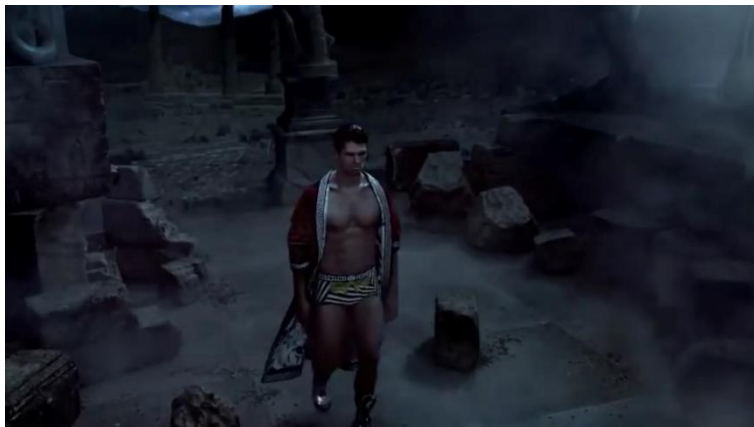
Figure 2b: Images extraites de la publicité Eros (© Versace 2012).