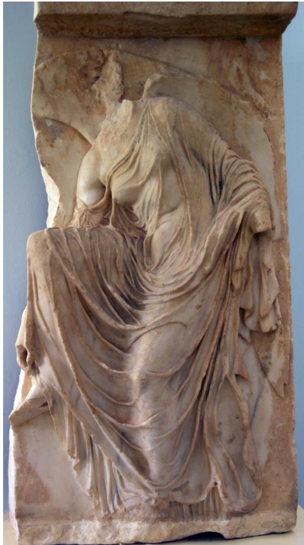
Figure 9c: Victoire à la Sandale, Musée de l'Acropole, Ve s av. J.- C.