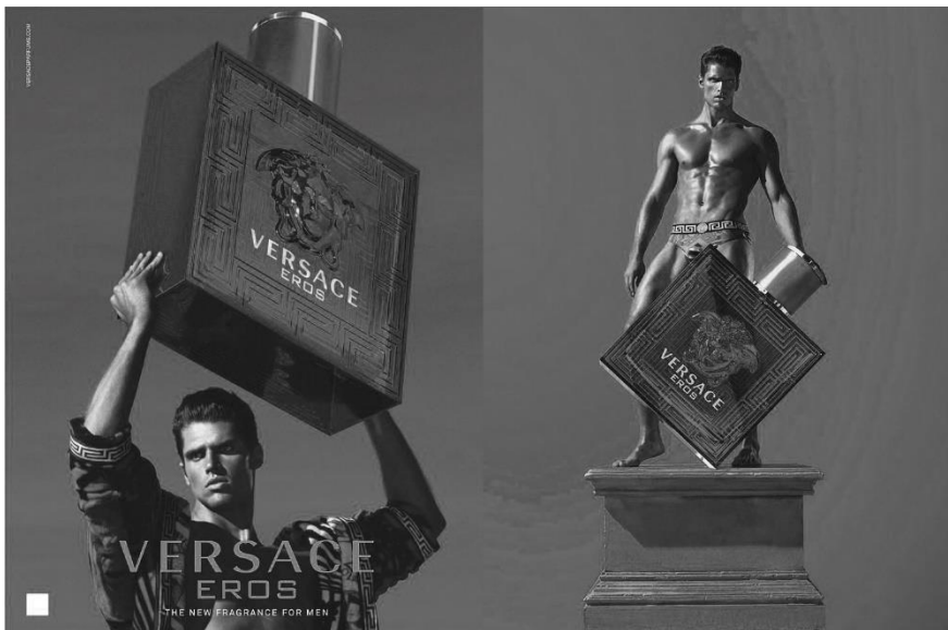
Figure 3b: Affiches pour Eros (© Versace 2012).