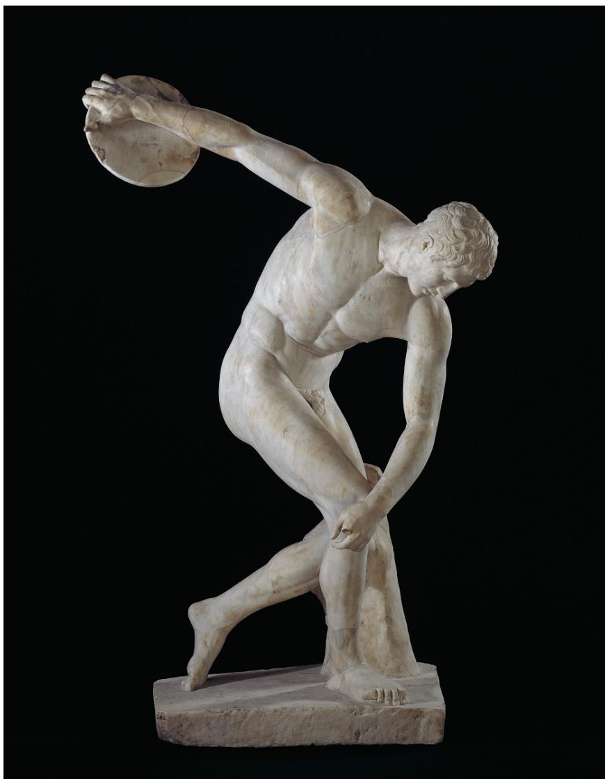
Figure 7c: Le Discobole, British Museum, copie romaine en marbre d'un original grec du Ve s av. J.-C., © Trustees of the British Museum.