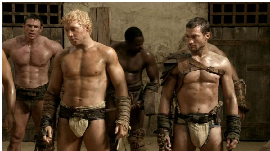
Figure 5b: Image extraite de la série Spartacus: blood and sand (Steven S. DeKnight)