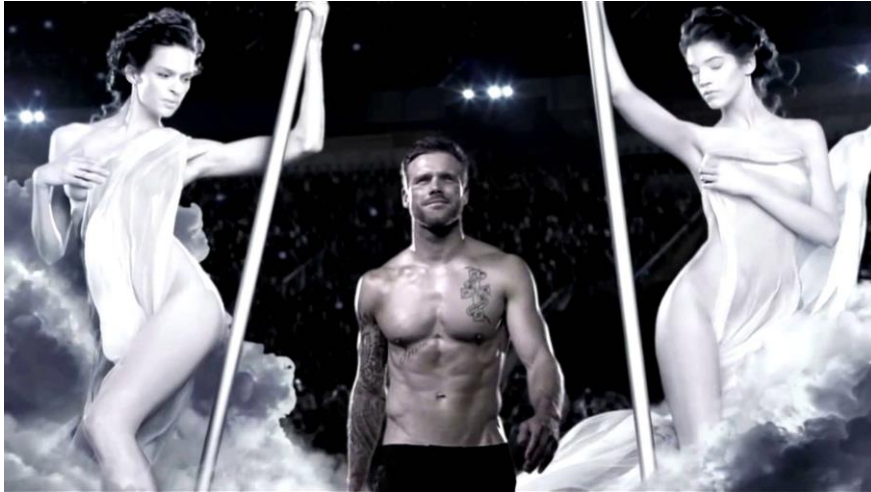
Figure 2a: Image extraite de la publicité Invictus