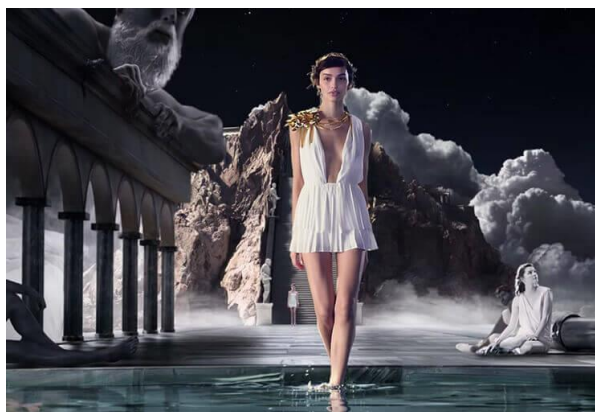
Figure 6d: Image extraite de la publicité Olympea (© Paco Rabanne 2015).