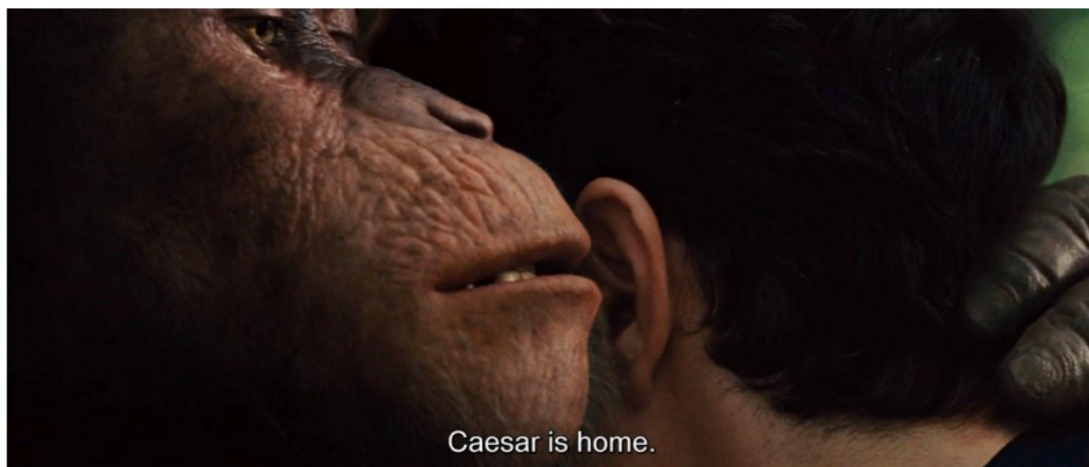
Rise of the Planet of the Apes (Rupert Wyatt, 2011)

C'est ce profond préjugé de l'homme comme unique maître et propriétaire des lieux qui rend à ce point scandaleux le titre du livre de Boule et des films qu'il a inspirés. Il y a erreur sur le primate ! Un effrayant quiproquo au sommet de la pyramide des espèces de Linné ! Puisque les singes singent l'homme (c'est le sens du terme « simiens », dérivé du mot similis ), parler de « planète des singes », c'est confondre au sens littéral le modèle et son simulacre , l'original et sa copie. Pourtant, ce cauchemar cinématographique, sous prétexte d'irriter la blessure narcissique des « petites différences », est une forme de réassurance fortifiant l'hégémonie et la primauté qu'il feint d'abolir. L'homme y joue à se faire peur. Cette société des singes est un plagiat trop évident, une transparente imposture, un jeu de monde inversé qui ne remet pas en cause la vision hégémoniste de l'espèce supérieure qui s'amuse à la produire. Dans le film de 1968, Charlton Heston est le visage, superbement américain, sublimement hollywoodien, supérieurement héroïque, du suprématisme humain jouant au complexe d'Ulysse contre une ménagerie de prétendants ridicules.