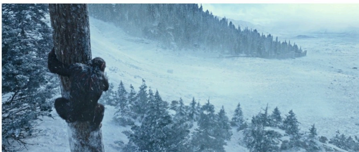
César regardant l'armée des humains ensevelie sous l'avalanche ( War for the Planet of the Apes , 2017)

La figure obsédante de la première série est celle du Retour. L'homme y voyage dans l'espace, l'homme y voyage dans le temps et ses voyages sont réversibles. Rien n'est jamais irrémédiable. Il reste toujours un espoir, en remontant dans le temps ou en tuant dans son germe un futur parcouru d'avance, de changer le cours des choses. De cet ensemble de films, que son nom soit avoué ou non, Ulysse est le vrai héros, en tant que son long périple n'est pas un voyage d'aventure, mais un circuit de retour ( nostos ). Dans le choix de cette forme et les jeux vertigineux de cet éternel retour, l'homme cherche à se persuader qu'il pourra toujours, comme Ulysse, revenir au point de départ, effacer les conséquences de ses dérives mortifères et réaffirmer sa domination. Et si cet éternel retour pouvait admettre une fin, cela ne changerait rien que le singe à la fin l'emporte, puisque ce qui aurait gagné serait la logique de suprématie qui fut la marque indélébile de la vie terrestre de l'homme.