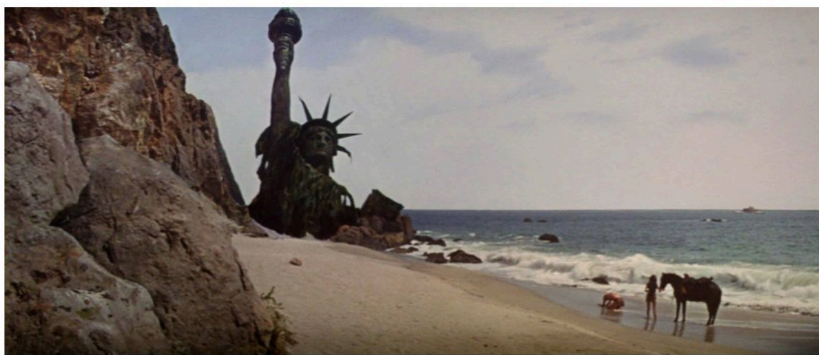
Charlton Heston découvrant les ruines de la statue de la Liberté ( The Planet of the Apes , 1968)

La première série des films La Planète des Singes , de celui de Franklin Schaffner (1968) et ses suites plus ou moins ratées jusqu'au film de Tim Burton réalisé en 2001, est l'ultime conséquence et la parfaite illustration de la vision galiléenne : une planète inconnue, que l'on croyait paumée à l'autre bout du ciel, s'y révèle être la Terre. Les vertiges de l'équivalence produisent un espace uniforme et connu a priori qui n'accouche que du même : L'espace à soi pareil qu'il s'accroisse ou se nie de l'ennui mallarméen. L'homme se retrouve chez soi en tout point de l'univers. On ne voyage que dans le temps : la planète des singes n'est pas un autre monde ; ce n'est que la planète Terre à un autre moment du monde. L'espace est un trompe-l'œil et une fausse fenêtre.