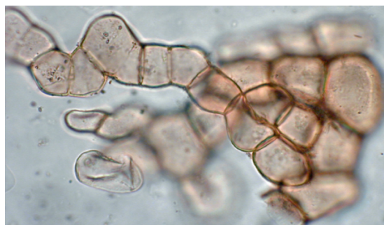
Fig. 7 : Hyphes de champignons observées dans les coquilles d’huitres de Cybèle (Lyon, Rhône).