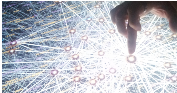
Figure 2 : Le système SKIPPI

• D'autres travaux nous ont permis de proposer et de développer un autre système d'aide à l'émergence d'idées créatives visant, dans ce cas, à tirer profit de relations établies entre des données lexicales (ou des mots) structurées en un graphe (cf. Figure 2). A l'issue d'études en psychologie ergonomique réalisées auprès de designers professionnels, des relations ont été définies - et implémentées dans le système SKIPPI - entre des données lexicales reflétant des connaissances et des règles métiers couvrant les métiers du design, du marketing, et de l'ingénierie produit-process (i.e. comprenant des « paramètres produits » tels que la forme, le matériau ou la couleur, et des « paramètres process » liés au processus de fabrication). Ce système permet aux utilisateurs d'avoir accès à des mots et à des liens entre ces mots, en tenant compte à la fois des émotions qui peuvent être véhiculées par les produits et de la valeur de marque, ce qui peut enrichir considérablement leur espace de recherche d'idées ou de nouvelles sources d'inspiration.