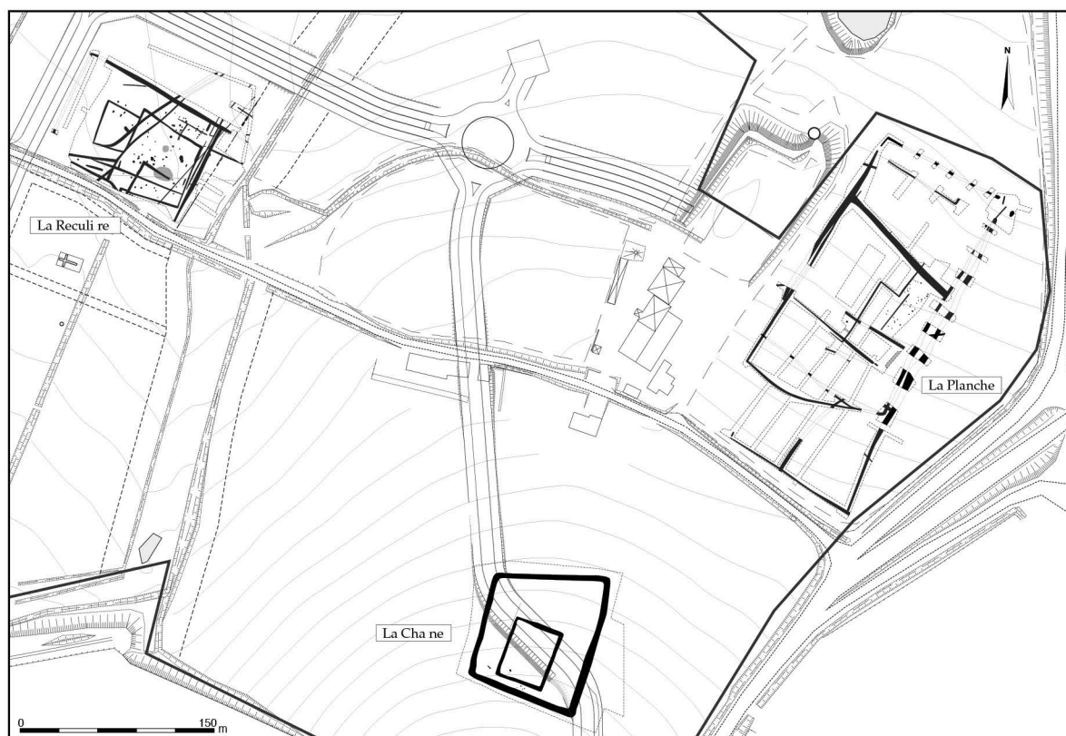
Z.A.C. de Beuzon : localisation des sites.

L'étude de la répartition spatiale des divers vestiges montre qu'il faut réserver une place particulière pour les ossements : ils sont essentiellement localisés dans un enclos.