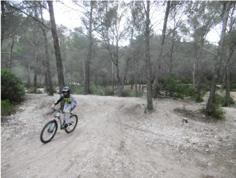
Figure 3. Vétériste aux portes du PNC.

création du PNC, les seconds étant nettement mieux dotés en ressources économiques, sociales et culturelles.