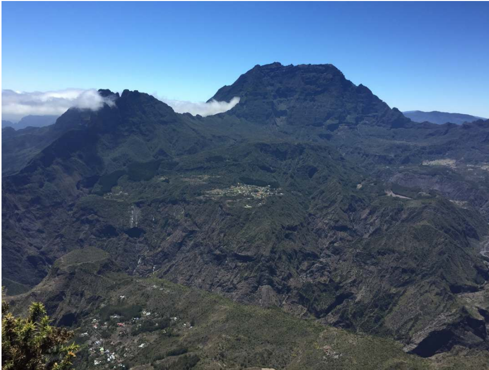
Figure 6. Mafate vu depuis le rempart du Maïdo.