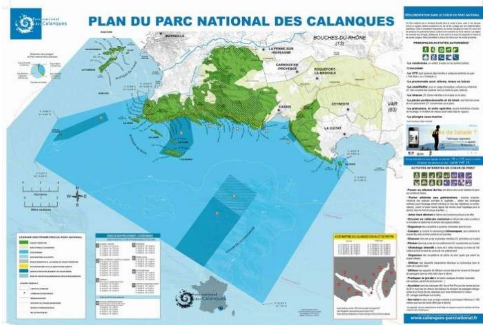
Figure 1. Carte du Parc national des Calanques (PNC).