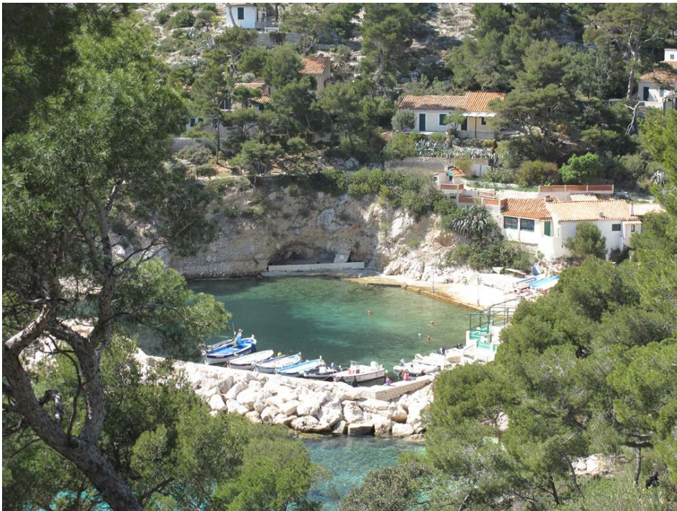
Figure 2. La Calanque de Sormiou, en cœur du PNC.