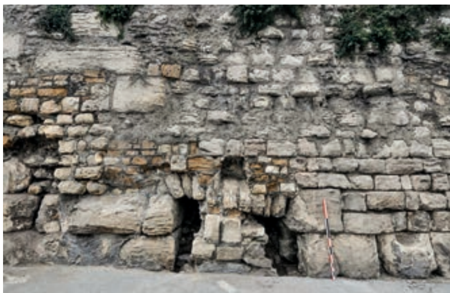
Fig. 98 – ARLES, Montée Vauban. Porte en cours de dégagement.

Cette étude a permis de cartographier les vestiges du rempart du Haut-Empire, ainsi que ceux du rempart du V e siècle qui ont été rehaussés par le rempart médiéval. Cet ensemble de maçonneries hétéroclites constituant le rempart méridional de la ville a été fortement impacté lors des campagnes de démolition dès le début du XIX e siècle, voire