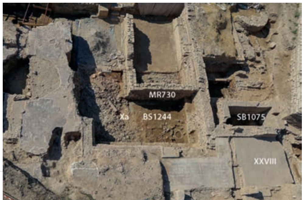
Fig. 96 – ARLES, Enclos de la Verrerie. Vue générale du site en fin de chantier le 28 juillet 2016 prise du sud.

complet; il correspond à un homme posé sur une forme de « planchette » en perspective (fig. 97, page suivante).