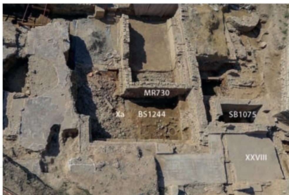
Fig. 96 – ARLES, Enclos de la Verrerie. Vue générale du site en fin de chantier le 28 juillet 2016 prise du sud.

complet; il correspond à un homme posé sur une forme de « planchette » en perspective (fig. 97, page suivante).