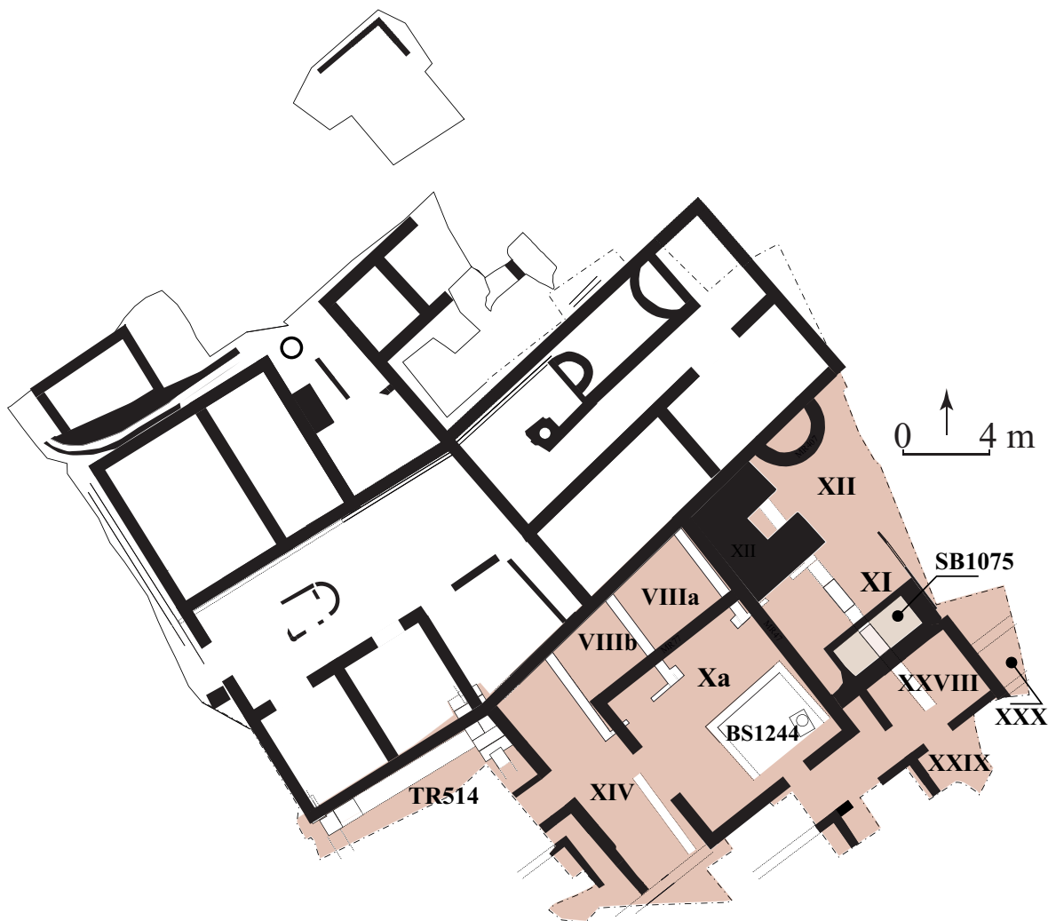
Fig. 95 – ARLES, Enclos de la Verrerie. Plan schématique des vestiges observés sur le site de la Verrerie, états 1 et 3. Murs blancs : I er siècle av. J.-C. Murs noirs : fin II e siècle apr. J.-C. (relevé : V. Dumas/CCJ; DAO : M.-P. Rothé, A. Genot).

alors que les domus voisines (n° 2 et n° 4) continuent de fonctionner. Le plan de la domus n° 4 dite de l'Aiôn a également été complété par la fouille de l'extrémité méridionale du couloir XIV et des pièces XXVIII et XXIX (fig. 95). La pièce XXVIII (fig. 95 et 96), desservie par une galerie mosaïquée, possède des parois peintes partiellement préservées 6 que viennent compléter les enduits fragmentaires retrouvés dans les niveaux d'effondrement de la pièce 7 . Les plaques déjà observées lors du prélèvement révèlent la présence, au centre de plusieurs panneaux, de personnages présents en vignette. Un au moins est