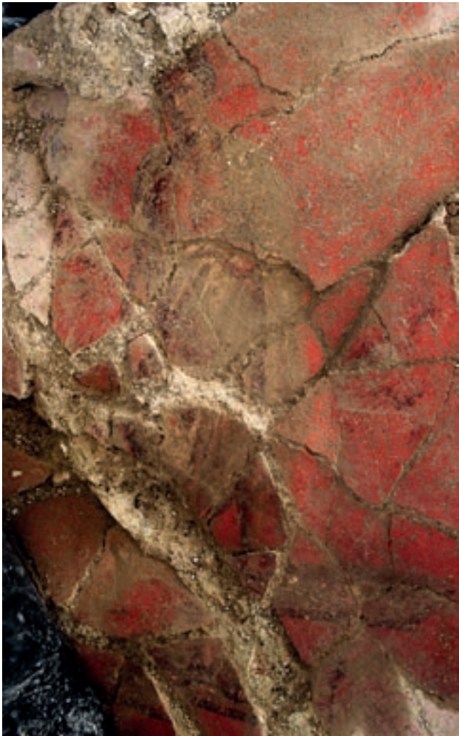
Fig. 97 – ARLES, Enclos de la Verrerie. Personnage en toge, décor peint de l'état 3.