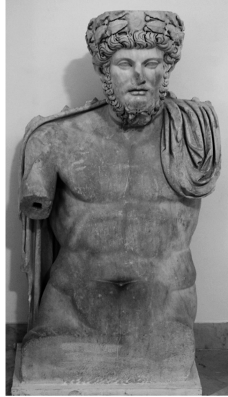
Fig. 2 – Statue de Lucius Verus, Tunis, Musée du Bardo

fêlure au côté gauche et de restaurations modernes au niveau de la main droite et de la torche. L'impératrice est représentée debout, de face, en appui sur la jambe droite, la gauche étant libre. Elle est vêtue d'une longue stola qui ne laisse découvertes que les extrémités des pieds et d'un ample manteau qui lui couvre la tête, ceinte en outre d'un diadème; de la main droite, elle tient une longue torche et de la main gauche, elle retient le pan de son manteau.