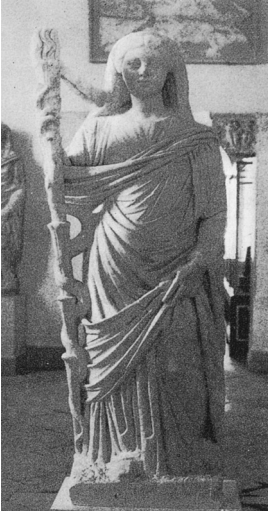
Fig. 3 – Statue de Lucille, Tunis, Musée du Bardo (source : Braemer 1982)