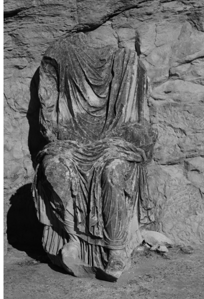
Fig. 6 – Statue de Marc Aurèle ou de Lucius Verus, théâtre de Dougga

pas non plus être apparentes. La contemporanéité et les similitudes de ces différents groupes statuaires impériaux découverts dans les théâtres d'Afrique Proconsulaire illustrent probablement un phénomène bien attesté dans cette région de l'Empire, celui de l' aemulatio municipalis . Thugga et Bulla Regia ne sont distantes que d'une cinquantaine de kilomètres; elles entretenaient certainement entre elles et avec les nombreuses autres cités environnantes une rivalité, qui pouvait se transcrire dans la parure monumentale ainsi que dans les formes d'hommage aux empereurs.