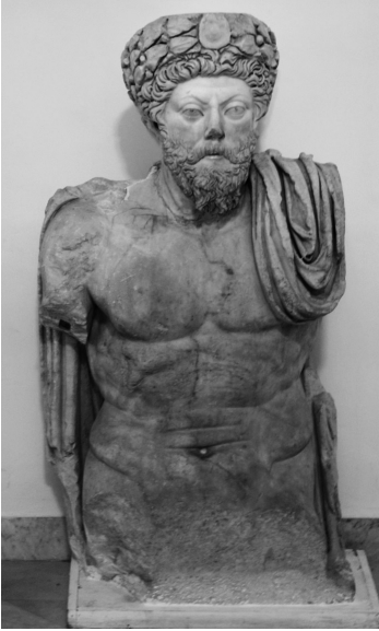
Fig. 1 – Statue de Marc Aurèle, Tunis, Musée du Bardo