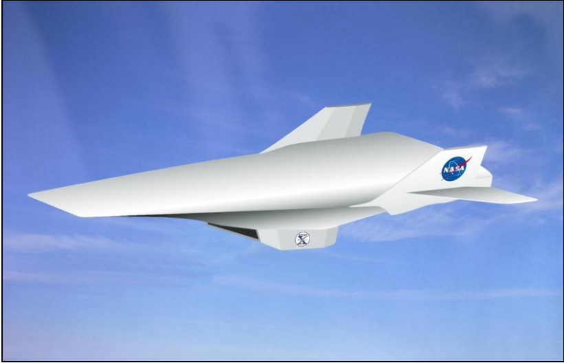
NASA Hyper-X Program