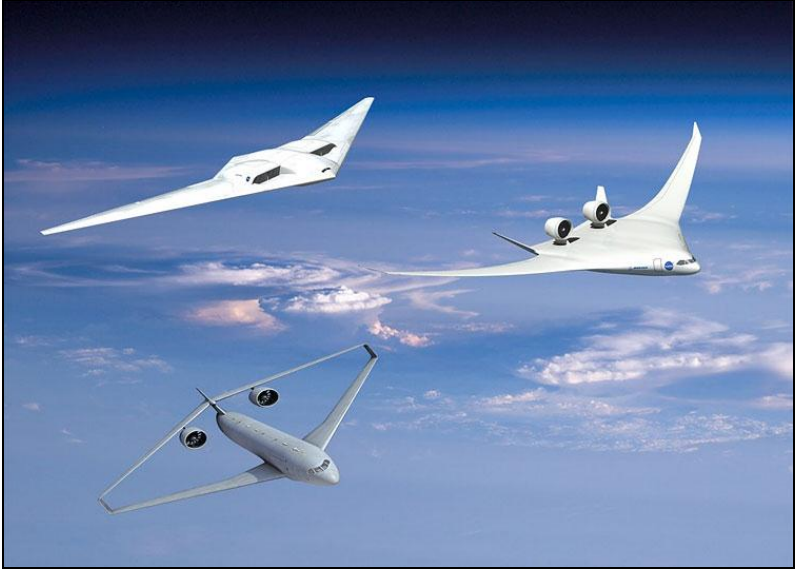
NASA 2025 Aircraft Program