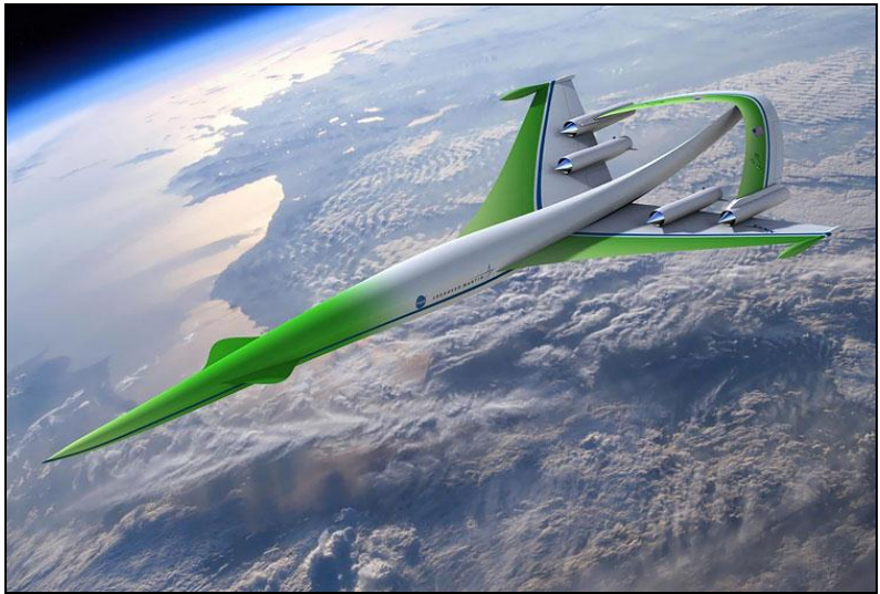
Lockheed Martin (NASA 2025 Aircraft Program)