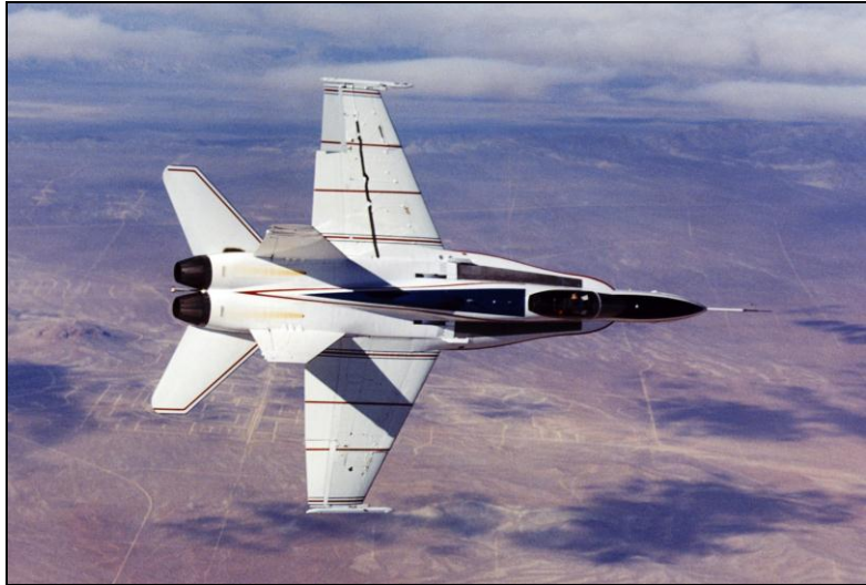
X-53 (Active Aeroelastic Wing)