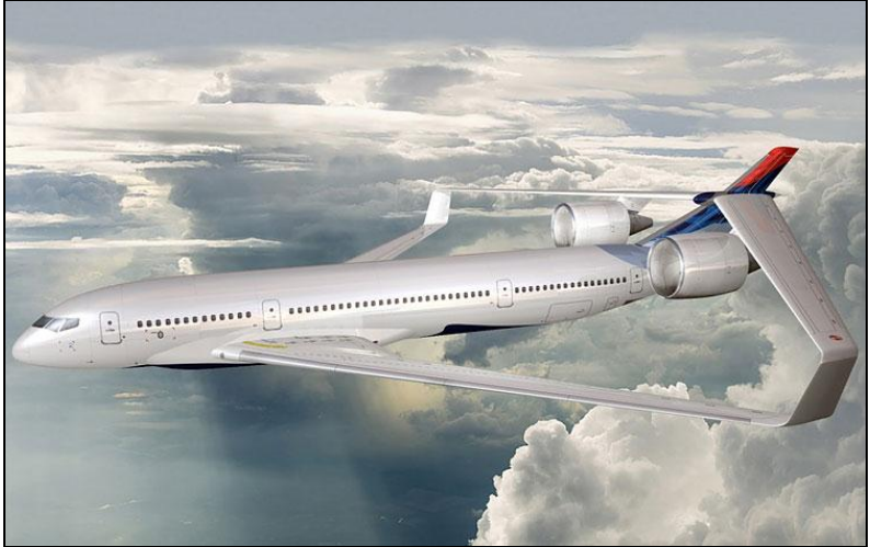
Lockheed Martin (NASA 2025 Aircraft Program)