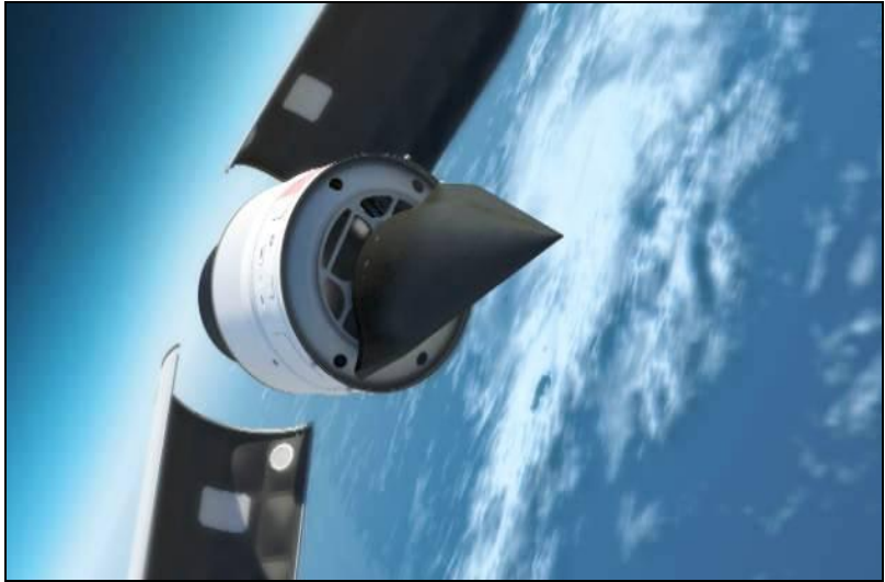
DARPA Falcon HTV-2