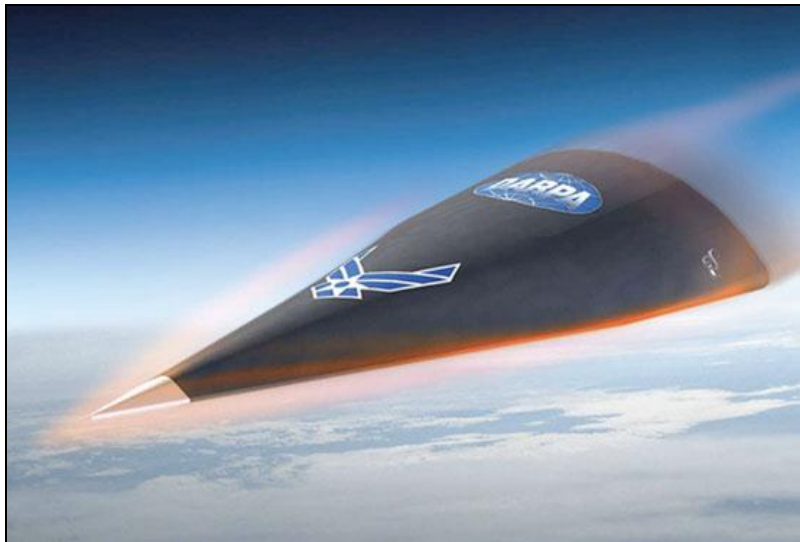
DARPA Falcon HTV-2