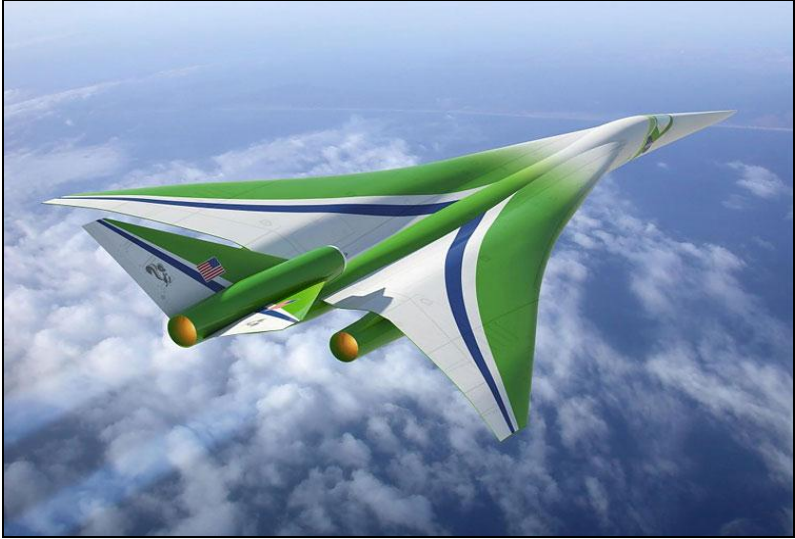
Lockheed Martin (NASA 2025 Aircraft Program)