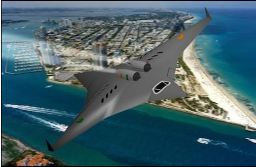
Supersonic bi-directional (SBiDir) flying wing (FW)