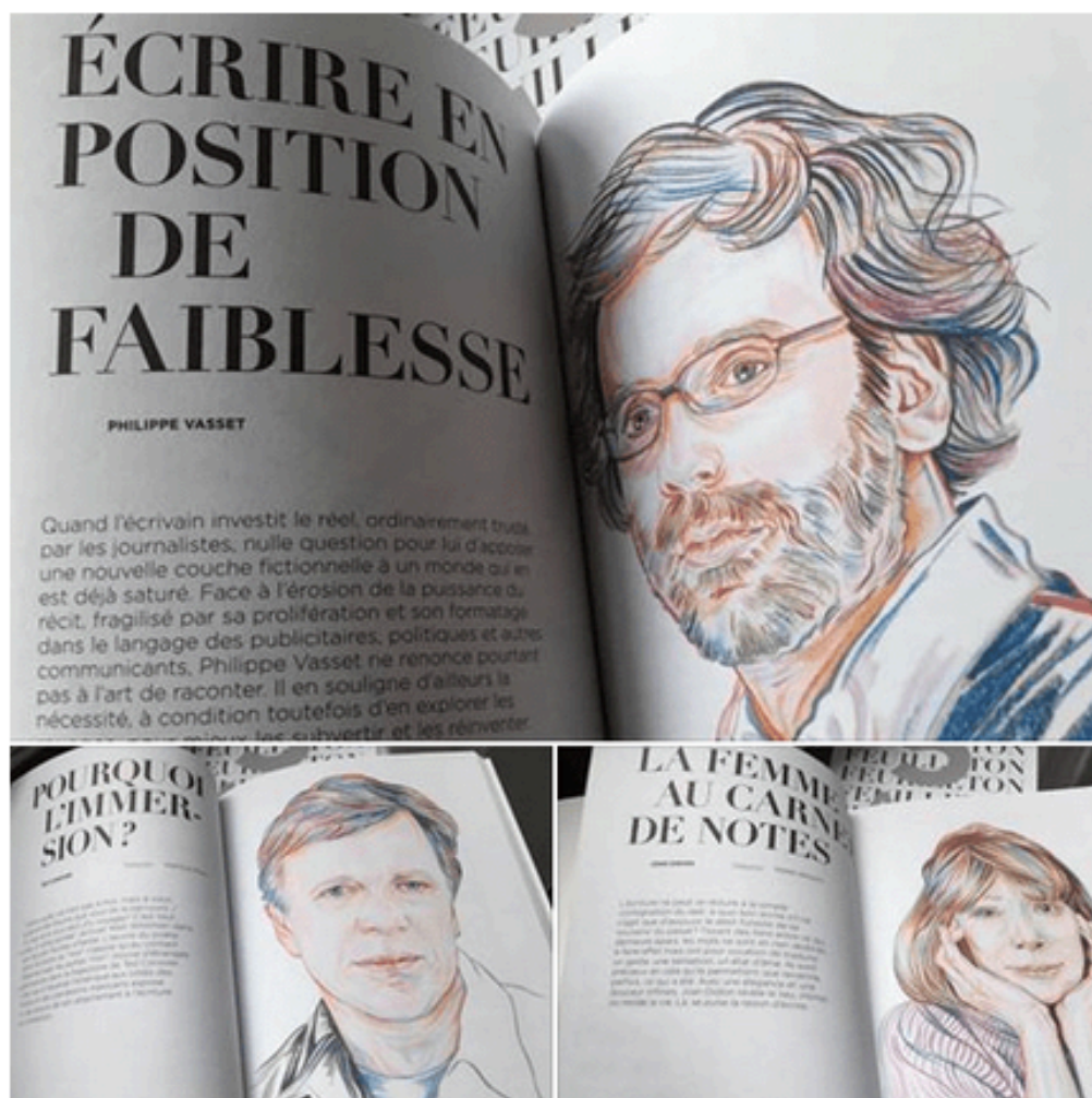
Feuilleton pour la littérature du réel (illustration Aline Zalco)

Offrir un espace et une tribune à la narrative non-fiction et au New Journalism littéraire, telle est la tâche à laquelle s'emploient, inlassablement, la revue Feuilleton comme les éditions du Sous-Sol . Si l'une comme l'autre ne sont pas les seuls lieux dans lesquels ce genre se déploie, ils n'en demeurent pas moins des acteurs centraux de la reconnaissance, en France, de ce genre fondamental aux États-Unis depuis les années 60 et dont les racines sont pourtant européennes et bien plus anciennes — la littérature dite « réaliste » du XIXe siècle, le journalisme d'enquête et d'infiltration des années 20/30, etc. Et c'est bien cette forme d'assomption progressive que célèbre le dernier numéro de Feuilleton — numéro anniversaire, la revue a cinq ans — sous un titre manifeste : « Pour la littérature du réel ».