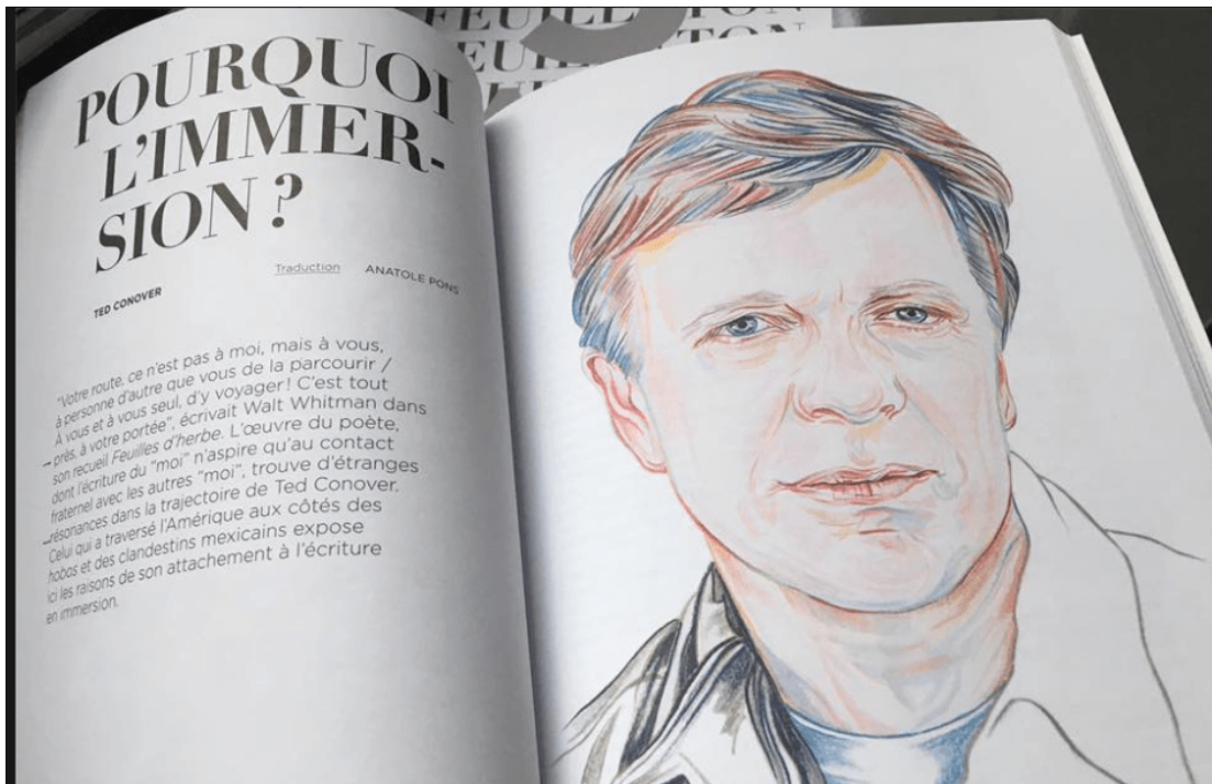
Feuilleton, Pour la littérature du réel

Janet Malcolm revendique ensuite, dans un entretien (d'abord publié dans la Paris Review ), la cruauté nécessaire du journaliste, la fabrique de ses livres, son rapport au texte dans la passion et le désir, son regard si particulier, entre reportage, biographie et récit, « moralelement indéfendable », comme elle le souligne dans Le Journaliste et l'assassin , livre justement commenté ensuite par Emmanuel Carrère. Au delà des questions liées à ses livres, aux polémiques qu'ils ont pu susciter, Janet Malcolm livre l'une des clés de cette littérature du réel, « je peux raconter, mais je ne peux pas inventer. Ce que les auteurs de non-fiction empruntent aux romanciers et aux nouvellistes, c'est le dispositif narratif ».