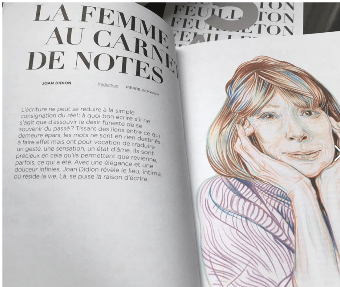
Feuilleton, Pour la littérature du réel

Ce sont cette singularité et cette diversité, cette « inclassabilité » écrit Ivan Jablonka, qu'illustrent les textes qui composent le numéro, jusque dans les champs linguistiques convoqués, des deux côtés de l'Atlantique principalement. Joan Didion d'abord, « La femme au carnet de notes », dévoilement d'un laboratoire d'écriture, d'un lieu depuis lequel consigner le réel ou la vie quotidienne, et mise en lumière du « je » qui rassemble les altérités rencontrées, les événements narrés, les faits saillants qui entreront dans l'œuvre : « nos carnets nous trahissent, car nous avons beau consigner tout ce que nous voyons autour de nous avec la plus grande objectivité possible, le dénominateur commun de tout ce que nous voyons est toujours, de manière évidente, éhontée, l'implacable « je » ».