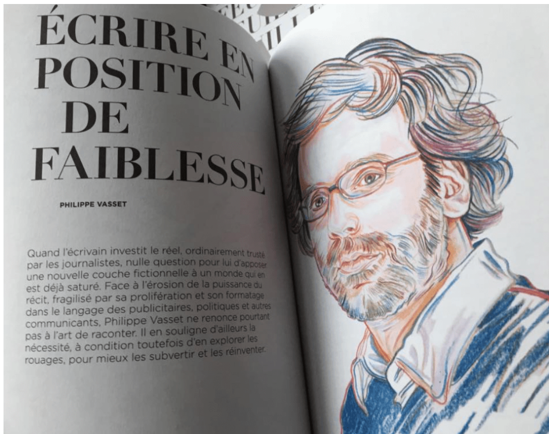
Feuilleton, Pour la littérature du réel