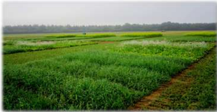
Figure 3 : Plateforme d'essais de CIMS à l'INRA de Lusignan

La section « Colza & autres crucifères » du CTPS transmet la demande auprès de la CISPS qui statue en mars sur la recevabilité du dossier VATE pour l'usage revendiqué. La commission définit le programme d'étude à mettre en œuvre en fonction du dossier technique du déposant et de la réglementation en vigueur. Celle-ci prévoit la mise en œuvre sur deux années consécutives d'un réseau d'essais de plein champ en semis d'été (début août à fin août) avec 4 lieux abritant un dispositif en blocs randomisés à 6 répétitions, et la réalisation d'un test artificiel de résistance variétale à la multiplication du nématode Heterodera schachtii (protocole officiel GEVES-Station Nationale d'Essais de Semences), (Figure 3).