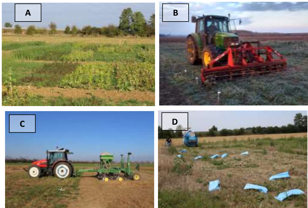
Figure 3 : Plateforme d'essai à l'INRA Dijon (Domaine d'Epoisses) sur les couverts d'interculture et leur effet sur les adventices sous divers niveaux de ressources et modalités de conduite. (A) couvert de 2 ou 8 espèces, avec ou sans légumineuses 60 jours après semis. (B) destruction d'un couvert au rolofaca sur le gel au 15 décembre. (C) Implantation de l'orge de printemps au 15 mars en semis direct. (D) récolte à la moissonneuse-batteuse expérimentale des micro-parcelles d'orge de printemps conduites sans azote et sans désherbage. (Crédit photo : Cordeau Stephane).

efficientes dans des niveaux de ressources en eau (Cordeau et al. , In prep) et en nutriments faibles (Moreau et al. , 2014). Il est donc nécessaire d'étudier les capacités de compétition des espèces de couverts dans des niveaux de ressources réduits ainsi que les possibilités de piloter la conduite des couverts (Figure 3, choix espèces, densité de semis, répartition de semis, irrigation potentielle, date de destruction, mode des destruction, etc...), pour maximiser leur installation et leur chance de concurrencer les adventices.