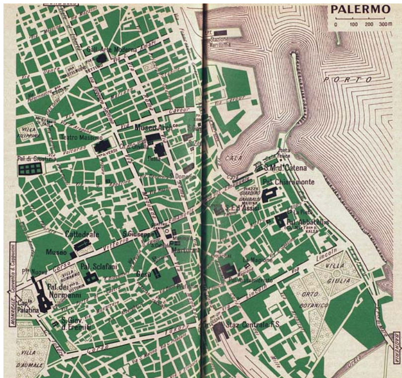
Fig. 1. Plan de Palerme.