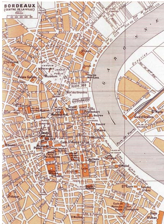
Fig. 5. Plan de Bordeaux.

Parmi les éléments du dispositif urbain décrits par les guides, on retient aussi le square , dont le statut est ambigu. En Grande-Bretagne, le terme apparaît avec différents sens : dans la dénomination d'un lieu (Albert Square), dans l'acception française (un jardin public situé au centre d'une place), pour désigner le square anglais (un espace libre au centre d'un îlot rectangulaire, utilisé par les habitants de l'îlot) ou pour désigner une place. Par rapport à l'acception française, le Lincoln Inn Fields est décrit comme « l'un des plus vastes squares de Londres » (p. 221). À Tunbridge Wells, le Pantiles est une « sorte de square entouré de magasins avec des galeries pour abriter les promeneurs » (p. 134).