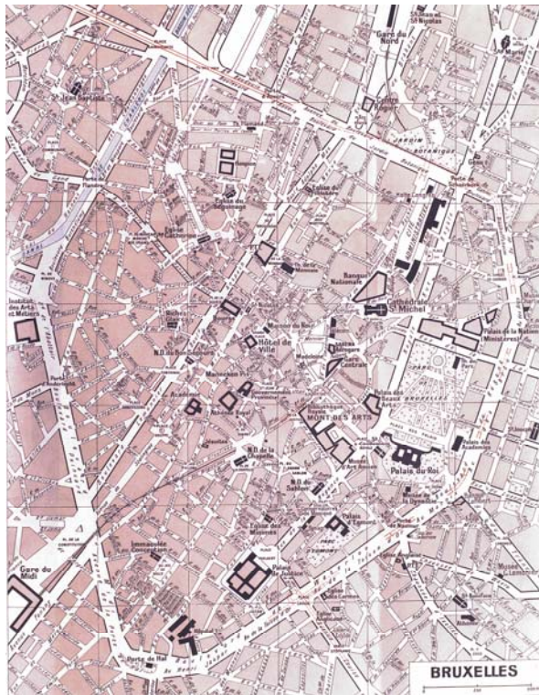
Fig. 2. Plan de Bruxelles.

Le boulevard est largement associé aux stations balnéaires. Le « boulevard maritime » (Dieppe) ou boulevard du Front-de-Mer (Antibes) constitue la « promenade habituelle des étrangers » tel La Croisette à Cannes, offrant de belles vues sur la vieille ville, sur l'Estérel et sur les îles de Lérins et permettant de rejoindre les bains de mer et autres distractions, tel le Palm Beach Casino .