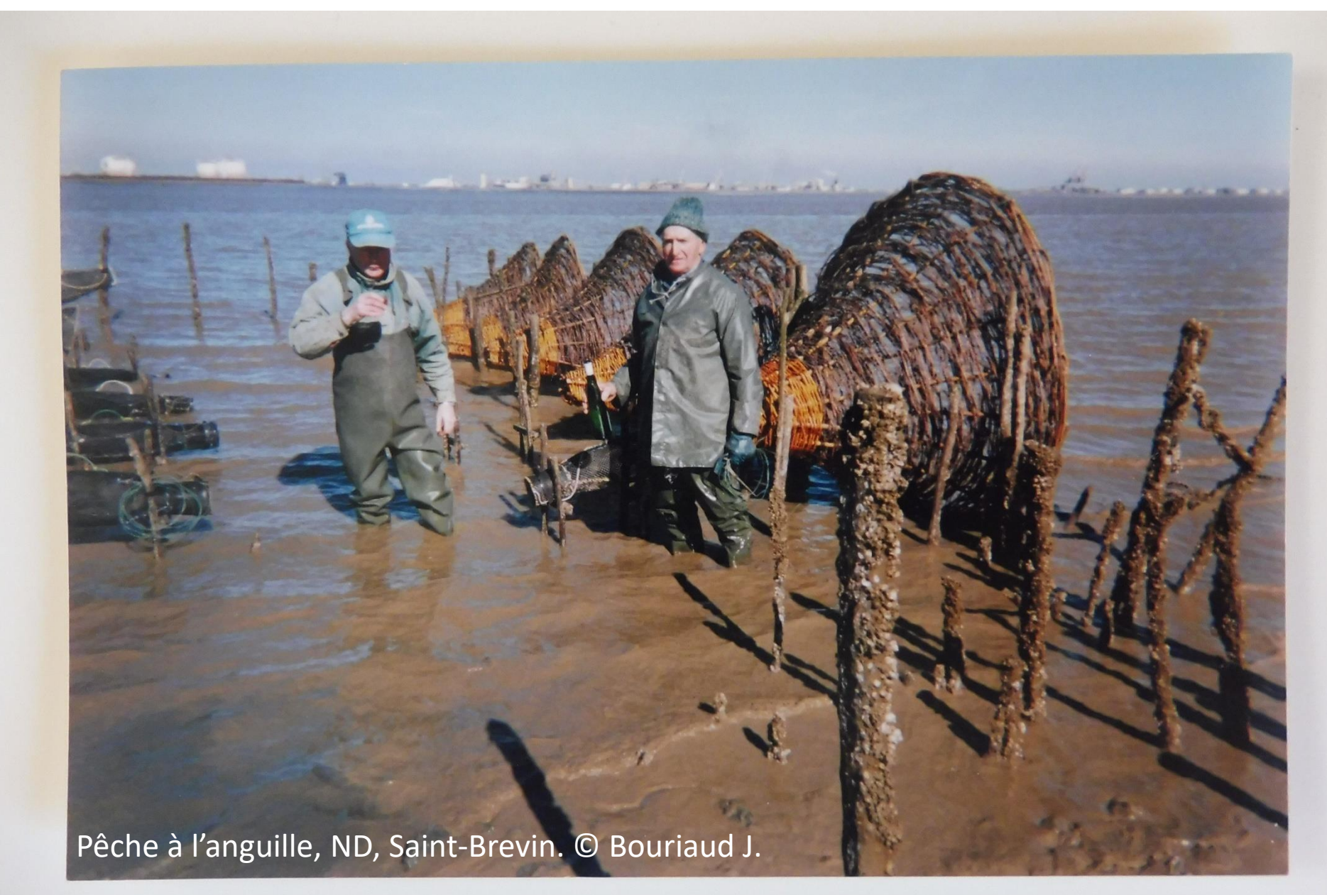
Pêche à l'anguille, ND, Saint-Brevin.