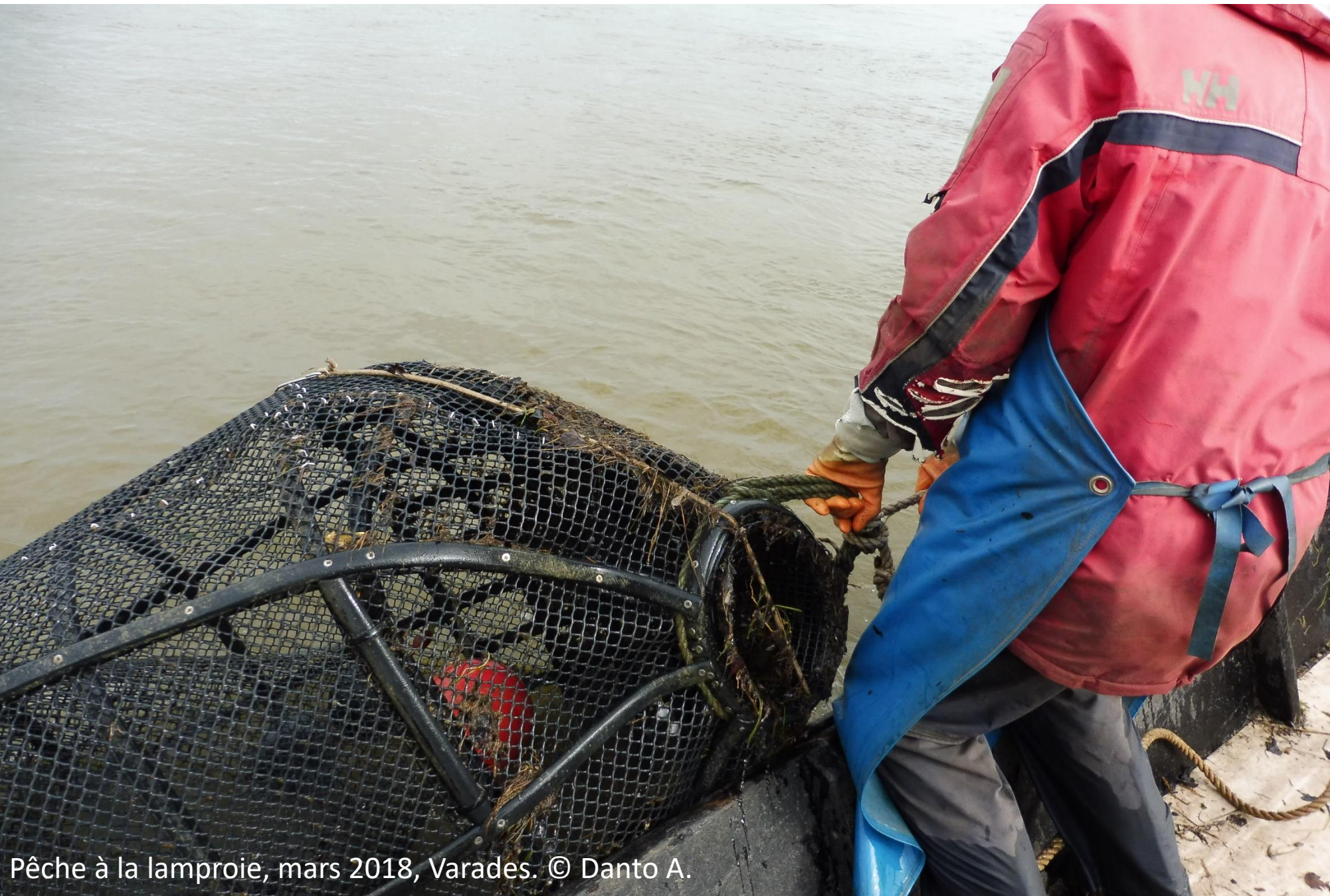
Pêche à la lamproie, mars 2018, Varades.