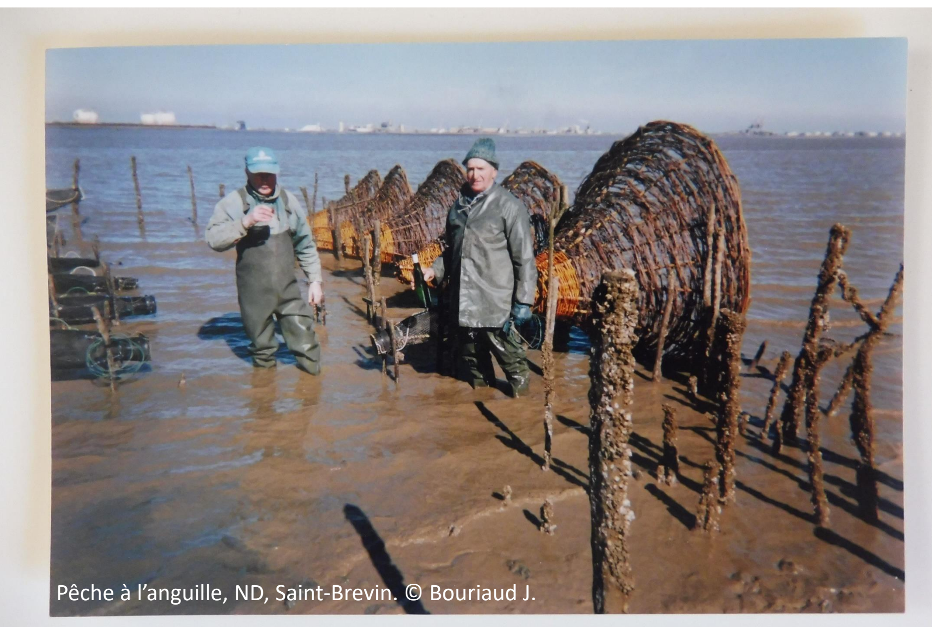
Pêche à l'anguille, ND, Saint-Brevin.