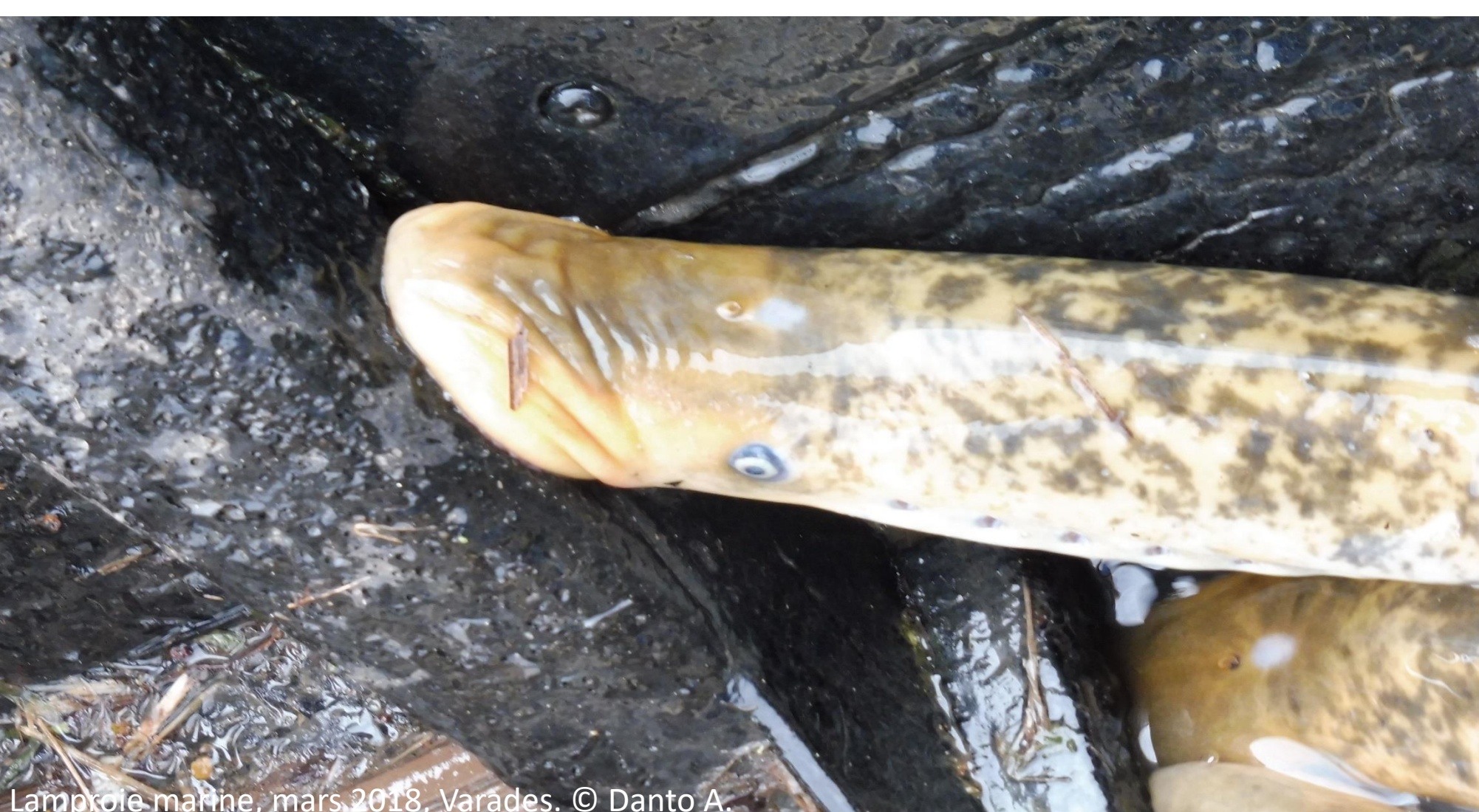
Lamproie marine, mars 2018, Varades.

L'acquisition de données biologiques et écologiques par des méthodes de SHS permettrait de relier Nature et Culture. Ainsi, les SHS apporteront une contribution pour une meilleure prise en compte du socio-écosystème lié aux amphihalins, dans une perspective de gestion soutenable.